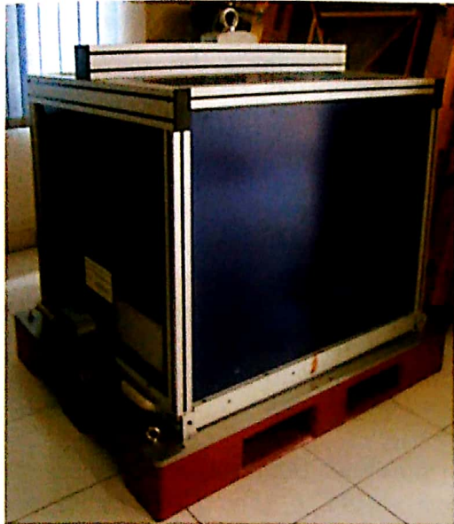
Gambar 3-2: Kontainer Satelit

yang diperlukan untuk membawa satelit dengan pesawat udara diperlukan alat bantu yaitu kontainer untuk pengiriman satelit. Kontainer dirancang sedemikian rupa agar satelit tidak rusak selama perjalanan.