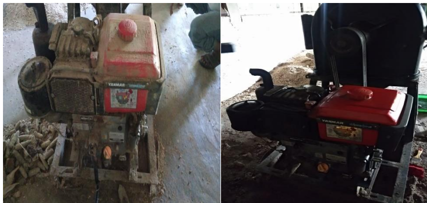
Gambar 12. Perbandingan mesin sesudah diperbaiki