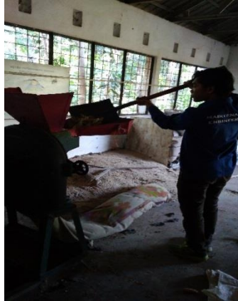
Gambar 9. Uji kinerja mesin

Hasil yang didapat dari perbaikan mesin disc mill ini adalah: