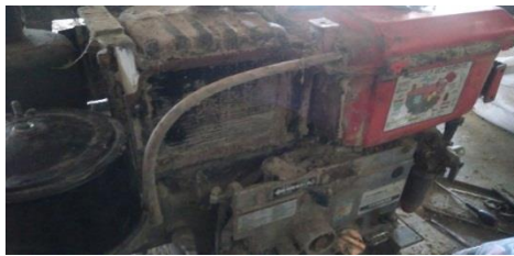
Gambar 8. Sistem pendingin (radiator) kotor

Area sistem pendingin (radiator) pada mesin disc mill mengalami penyumbatan. Kotoran yang menumpuk dan menempel menjadikan aliran udara pada sistem pendingin tersumbat. Maka dari itu pembersihan area pendingin harus dilakukan.