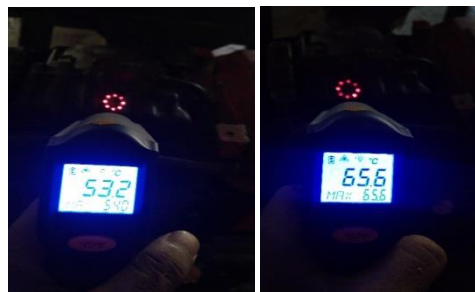
Gambar 11. Hasil Thermometer infra red