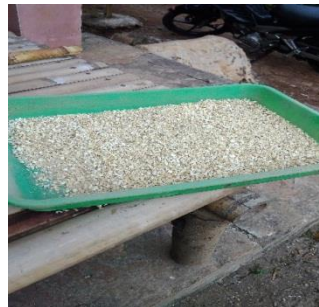
Gambar 10. Hasil penggilingan