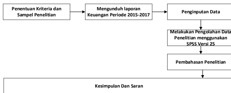
Gambar 2 Langkah-langkah Penyelesaian Masalah

Berikut Gambar 2 mengenai langkah-langkah penyelesaian masalah penelitian: