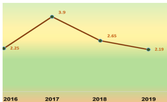
Gambar 1. Perkembangan Inflasi Kota Magelang Tahun 2016-2019 (Persen)

Inflasi merupakan kenaikan jumlah uang beredar atau kenaikan likuiditas dalam suatu perekonomian dengan gejala umum yang ditimbulkan oleh adanya kenaikan harga-harga secara umum dan terus menerus [3]. Dalam membahas inflasi kota Magelang, perkembangan inflasi di kota Magelang tahun selama tahun 2019 hanya sebesar 2.19 persen. Walaupun inflasi tersebut rendah secara statistik, namun inflasi lebih sering terjadi daripada deflasi artinya tiap bulan harga-harga produk yang dikonsumsi masyarakat terus mengalami kenaikan meskipun pertambahan kenaikannya tidak besar.