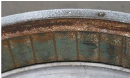
Gambar 2. Rotor ( Permanent Magnet ) BLDC Motor

Rotor adalah bagian motor yang berputar karena adanya gaya elektromagnetik dari stator. Rotor pada motor BLDC berbeda dengan rotor pada motor DC konvensional yang hanya tersusun dari satu buah elektromagnet yang berada di antara brushes (sikat). Rotor terdiri dari beberapa magnet permanen yang saling direkatkan dengan epoxy, serta jumlahnya dapat di-variasikan sesuai dengan desain. Jumlah kutub magnet berbanding lurus dengan torsi motor, namun berbanding terbalik dengan RPM. Semakin banyak jumlah kutub magnet pada rotor, semakin tinggi pula torsi yang akan dihasilkan, namun konsekuensinya RPM motor akan turun. Resistansi kumparan yang semakin rendah dalam rumus hukum ohm I=V/R , maka semakin rendah nilai R maka akan menjadikan I (amper) semakin besar. Semakin besar amper tentunya akan menyebabkan watt meningkat pula [6]. Untuk lebih jelasnya dapat dilihat seperti pada Gambar 2. dibawah ini.