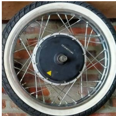
Gambar 1. Motor BLDC Type E-BIKE

Salah satu jenis motor listrik yang paling banyak digunakan akhir-akhir ini adalah Brushless DC (BLDC) Motor dimana motor DC ini tidak menggunakan Brush (sikat) untuk proses komutasi. BLDC motor banyak digunakan pada teknologi otomasi mutakhir, seperti: otomasi industri manufaktur maupun otomasi non-manufaktur (Robot, UAV, ROV, aeromodeling, hingga RC cars). Konstruksi yang sangat simpel menjadi pertimbangan pemakaian BLDC motor pada pengembangan bidang otomasi tersebut. Untuk lebih jelasnya dapat dilihat seperti pada Gambar 1 dibawah ini [4].