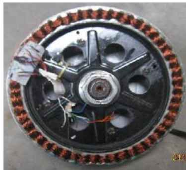
Gambar 3. Stator (Kumparan) BLDC Motor

Stator adalah bagian motor yang diam/statis dimana fungsinya sebagai medan putar motor untuk memberikan gaya elektromagnetik pada rotor sehingga motor dapat berputar. Stator pada BLDC motor hampir sama dengan stator motor listrik konvensional, hanya berbeda pada lilitannya. Stator terbuat dari tumpukan baja yang dilaminasi dan berfungsi sebagai tempat lilitan kawat. Lilitan kawat pada BLDC motor biasanya dihubungkan dengan konfigurasi bintang atau Y. Pada motor DC brushless statornya terdiri dari 12 belitan (elektromagnet) yang bekerja secara elektromagnetik dimana stator pada motor DC brushless terhubung dengan tiga buah kabel untuk disambungkan pada rangkaian kontrol, sedangkan pada motor DC konvensional stator-nya terdiri dari dua buah kutub magnet permanen [7]. Untuk lebih jelasnya dapat dilihat seperti pada Gambar 3 dibawah ini.: