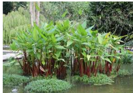
Gambar 1. Tanaman Kana Air ( Thalia geniculata )

Proses pengolahan air limbah dilanjutkan dengan proses didalam constructed wetland berupa lahan peralihan antara bagian daratan dan perairan di mana sebagian besar formasinya adalah air. Sistem constructed wetland biasanya memanfaatkan beragam tanaman yang berhabitat pada lingkungan akuatik (Stefanakis, 2019).