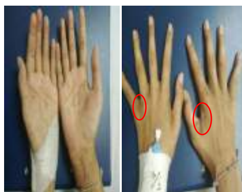
Gambar 2: multiple papul hiperpigmentasi, batas tidak jelas, krusta hiperkeratotik (+) pustula dan erosi (-) (lingkaran merah).