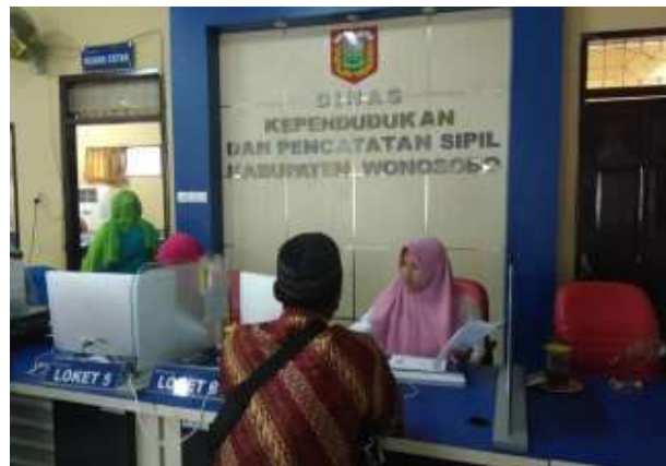
Gambar 5. Kegiatan pelayanan oleh pegawai Dinas Kependudukan dan Pencatatan Sipil Kabupaten Wonosobo