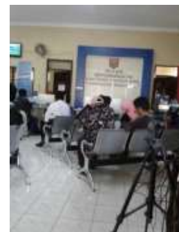
Gambar 4. Tempat menunggu masyarakat pengunjung