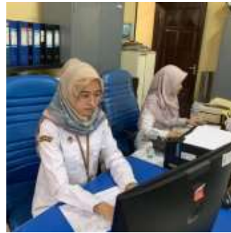
Gambar 3. Fasilitas fisik Dinas Kependudukan dan Pencatatan Sipil Kabupaten Wonosobo

Berdasarkan wawancara pada tanggal 27 Desember 2022 dengan Ibu Rus selaku Sub Bagian Umum dan Kepegawaian Dinas Kependudukan dan Pencatatan Sipil Kabupaten Wonosobo mengatakan bahwa: