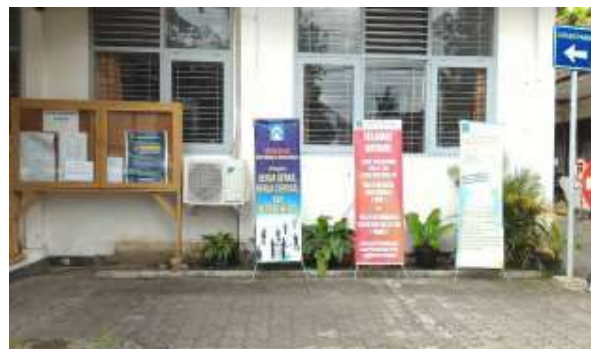
Gambar 7. Papan Informasi Dinas Kependudukan dan Pencatatan Sipil Kabupaten Wonosobo