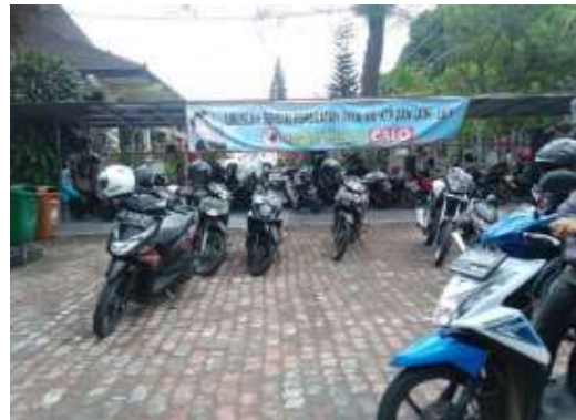
Gambar 6. Tempat parkir luar