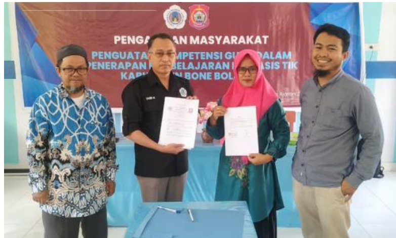
Gambar 6. Hasil penandatanganan IA