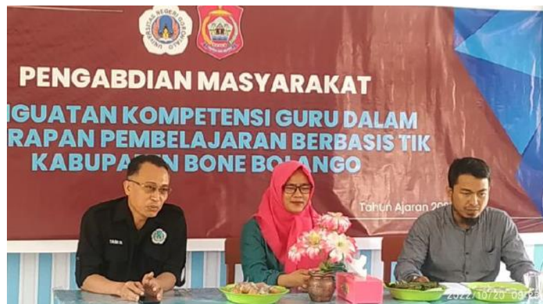
Gambar 2. Acara pembukaan, di hadiri oleh ketua Jurusan Teknik Elektro dan Kepsek

Persiapan kegiatan yang dilakukan oleh tim pengabdian di Sekolah Dasar Negeri 3 Kabila Bone diawali dengan sambutan baik dari ketua tim pengabdian dan oleh pihak mitra dalam hal ini kepala Sekolah Dasar Negeri 3 Kabila Bone yang didokumentasikan pada gambar 2 dan selanjutnya dilanjutkan dengan acara workshop.