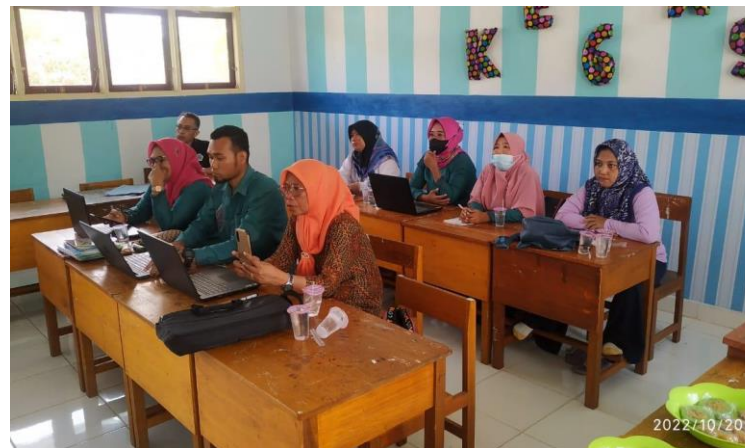
Gambar 4. Guru-guru focus dengan pemberian materi dari narasumber