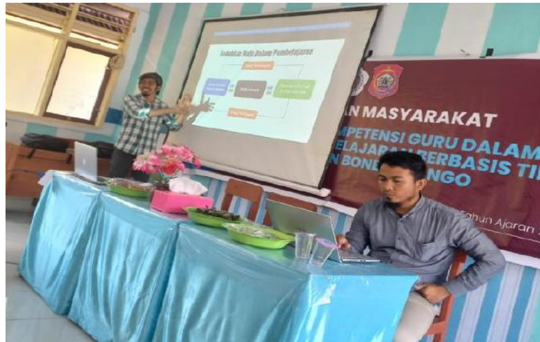
Gambar 3. Proses penyampaian materi