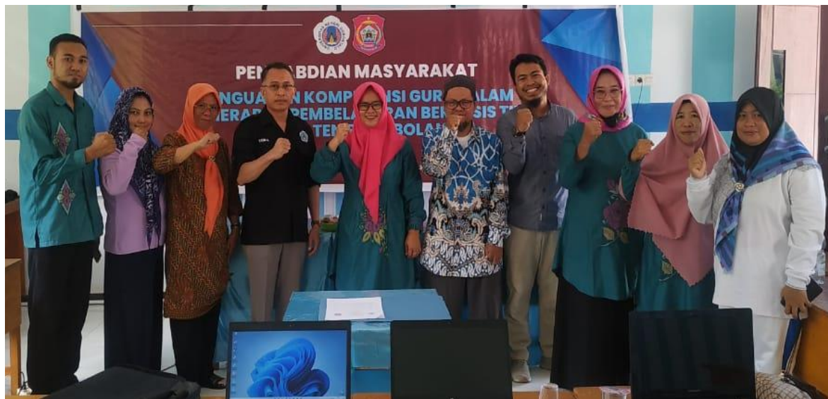
Gambar 7. Acara penutupan workshop

Penyampaian materi yang diperlihatkan pada gambar 3 mengenai penguatan kompetensi guru dalam penerapan pembelajaran berbasis TIK. Mitra dalam hal ini guru saat menerima materi diperlihatkan pada gambar 4. Setelah acara workd shop selesai dilanjutkan dengan penandatanganan dari ketua tim pengabdian dan kepala sekolah SDN 3 Kabila Bone yang diperlihatkan pada gambar 5 dan gambar 6. Selanjutnya adalah sesi foto bersama setelah acara selesai diperlihatkan pada gambar 7.