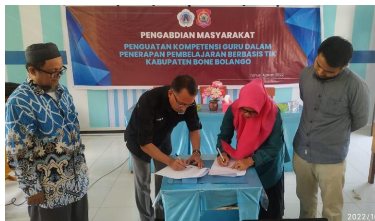
Gambar 5. Proses penandatanganan IA