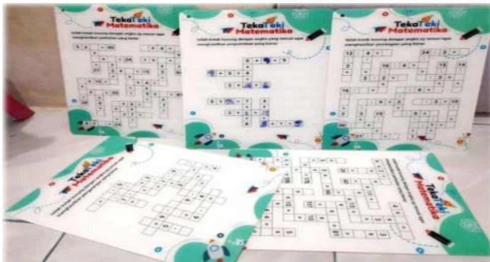
Media Teka Teki Silang Matematika

Syafri (2016) menyatakan media visual tiga dimensi adalah media yang dapat dilihat yang memiliki unsur berupa garis, bentuk, warna dan tekstur. Media permainan TTS Matematika terdiri dari TTS penjumlahan, TTS pengurangan, TTS perkalian dan TTS pembagian. Berikut merupakan gambar media TTS Matematika yang telah diuji kevalidan dan kepraktisannya.