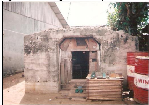
(Foto 5) Sebuah bunker Jepang disengaja dipendam (Foto 6) bunker yang dipakai untuk rumah penduduk