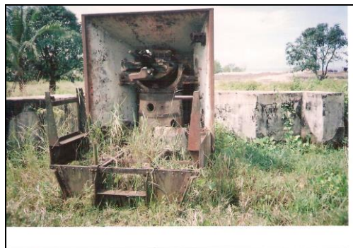
(Foto2) Meriam yang diambil perengkapannya (Tarakan)