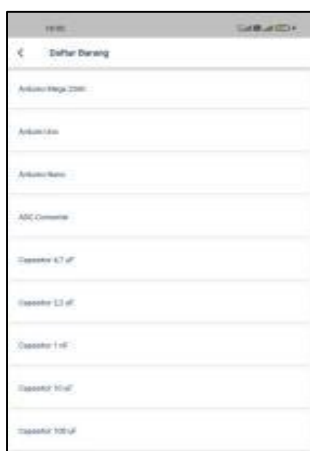
Gambar 4. Tampilan Daftar Barang

Pada Gambar 4 terdapat beberapa daftar barang yang tersedia di Laboratorium Teknik Komputer dan juga tersedia tombol untuk menambahkan barang.