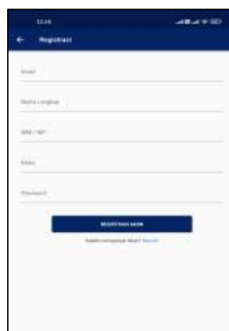
Gambar 2. Tampilan Registrasi

Pada Gambar 2 merupakan halaman untuk membuat akun dan mendaftarkan diri sebagai pengguna baru. Ada beberapa kolom yang wajib diisi sebelum menjadi pengguna baru yaitu Email, Nama Lengkap, Nim, Kelas, Password. Setelah melengkapi kolom pendaftaran selanjutnya user dapat menekan tombol "Registrasi Akun" untuk menyelesaikan pendaftaran.