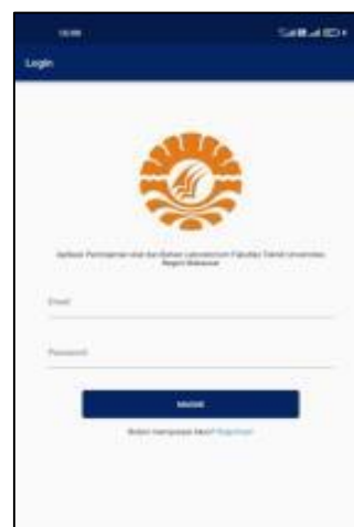
Gambar 1. Halaman Login