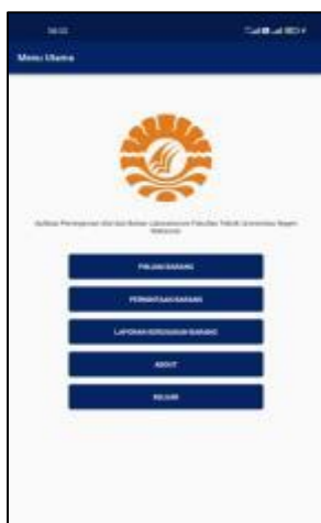
Gambar 5. Tampilan Menu Utama User

Pada Gambar 5 terlihat tampilan menu utama dan terdapat beberapa pilihan menu yaitu Pinjam Barang, Permintaan Barang, Laporan Kerusakan Barang, About dan Keluar .