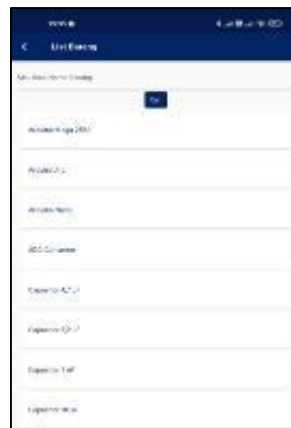
Gambar 6. Tampilan menu Peminjaman

Pada Gambar 6 terlihat tampilan dari menu pinjam barang yang berisi daftar barang yang tersedia di laboratorium dan kolom untuk memasukkan nama barang yang ingin dicari serta tombol "CARI" untuk memproses pencarian barang.