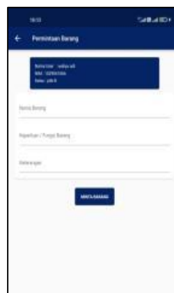
Gambar 7. Tampilan Permintaan Barang

Pada Gambar 7 merupakan tampilan dari permintaan barang yang terdiri dari beberapa kolom yang harus diisi jika ingin melakukan pengajuan atau permintaan barang diantaranya yaitu Nama Barang, Keperluan/Fungsi Barang dan Keterangan serta terdapat tombol "MINTA BARANG" untuk memproses permintaan.