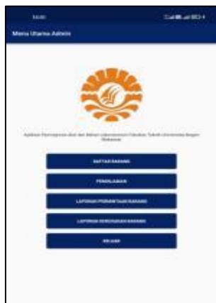
Gambar 3. Halaman Utama Admin