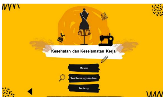
Gambar 3. Menu Home