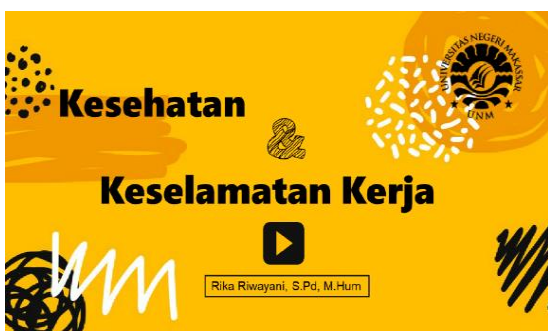
Gambar 2. Splash Screen