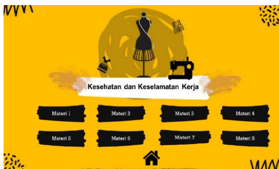
Gambar 4. Menu Materi