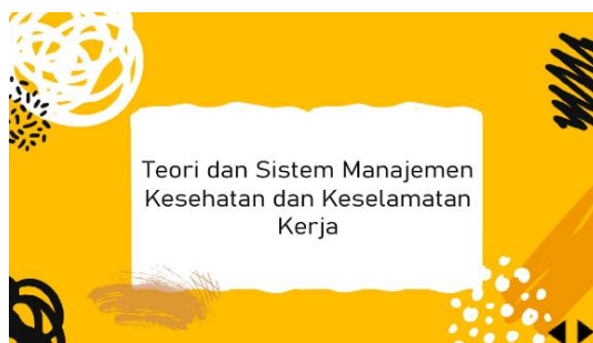
Gambar 5. Tampilan Awal Materi 1

Berikut ini merupakan hasil dari pengembangan media pembelajaran berbasis audio visual pada Mata Kuliah Kesehatan dan Keselamatan Kerja (K3) menggunakan Adobe Flash CS6 dengan menerapkan model pengembangan 4D yang terdiri dari 4 tahapan, yaitu define, design, develop, dan disseminate .