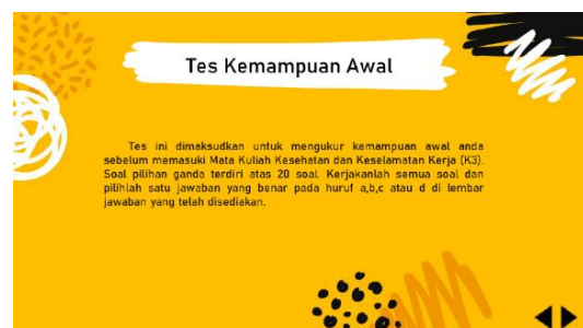
Gambar 7. Menu Tes Kemampuan Awal