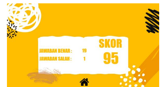
Gambar 8. Tampilan Hasil Tes Kemampuan Awal