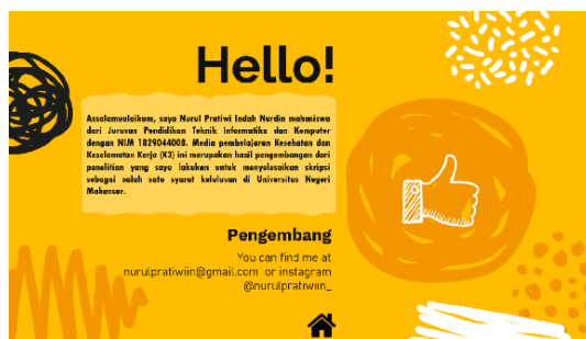
Gambar 6. Menu Tentang