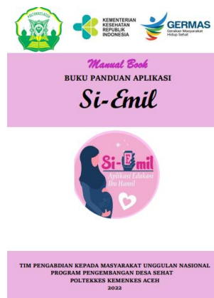
Gambar 1. Manual Book Si-Emil

Kegiatan pengabdian masyarakat berupa pelatihan penggunaan aplikasi untuk mendampingi ibu hamil dalam mendapatkan informasi berupa pengetahuan seputar gizi dalam kehamilan. Kegiatan diadakan di Puskesmas Kecamatan Nurussalam, dan dilaksanakan tanggal 15 September 2022. Kegiatan pengabdian masyarakat ini berlangsung secara luring, dan dihadiri 1 orang kepala puskesmas, 1 orang bidan koordinator, 1 orang TPG, 1 orang kabid kesehatan ibu dan anak, 3 orang bidan desa sebagai pendamping bumil yang berjumlah 46 orang. Pada tahap awal persiapan, yaitu kelengkapan administrasi berupa surat izin ke Kepala Puskesmas Nurussalam, sebagai wilayah kerja dari Kecamatan Nurussalam. Kemudian mempersiapkan bahan-bahan sosialisasi dan pelatihan. Materi dan bahan pelatihan berupa aplikasi pendampingan ibu hamil beserta manual book buku panduan aplikasi Si-Emil.