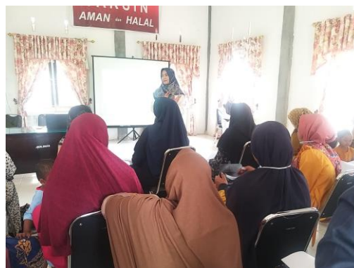
Gambar 2. Sosialisasi Aplikasi Si-Emil

Pada tahapan pelaksanaan sosialisasi dan pelatihan edukasi pada ibu hamil (Si-Emil) dengan pelaksanaan di Puskesmas Nurussalam sebanyak 46 orang ibu hamil didampingi oleh bidan desa dan bidan koordinator dari masing-masing desa.