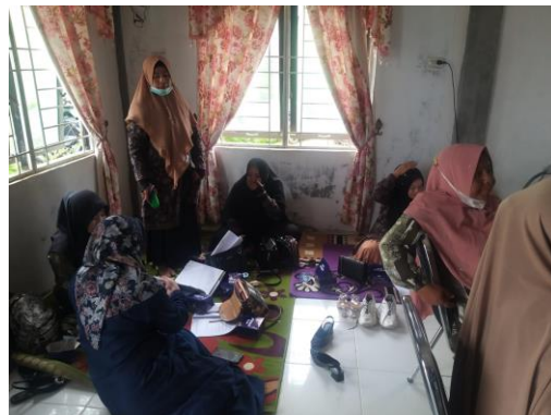
Gambar 4. Pelatihan Pengisian Si-Emil Bagi Bidan, Kader, TPG

Peserta pelatihan terlihat antusias dengan materi yang disampaikan. Hal ini terlihat dari mulai acara semua materi yang dijelaskan khususnya bagaimana menggunakan aplikasi, diterima dengan baik oleh semua peserta termasuk ibu bidannya. Selanjutnya tahapan evaluasi, tim pelaksana pengabdian memberikan umpan balik kepada peserta, terutama kepada ibu-ibu hamil yang menjadi sasaran kegiatan ini. Umpan balik berupa kuesioner, yang diisi langsung melalui form google, dengan hasil sebagai berikut :