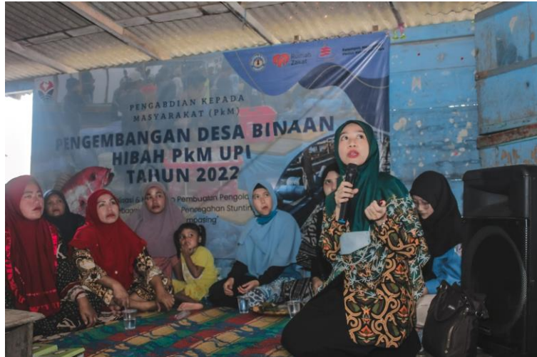
Gambar 4. Sosialisasi pemenuhan gizi keluarga