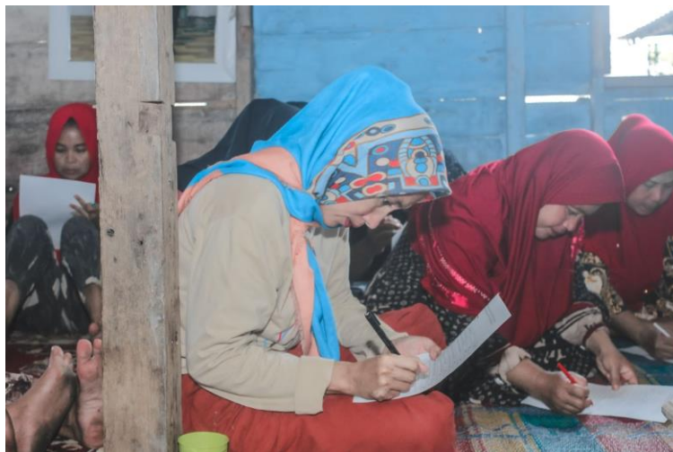
Gambar 3. Pengerjaan kuesioner sebelum pematerian

Dalam kegiatan ini dapat dilihat kebiasaan masyarakat sehari-hari menunjukkan dalam mengonsumsi makanan beragam masih tergolong rendah. Hal ini disebabkan oleh tingkat kesejahteraan masyarakat yang masih tergolong rendah. Saat mereka melaut dan menghasilkan ikan-ikan yang beragam, mereka lebih memilih untuk menjual daripada untuk dikonsumsi. Dari hasil pengisian kuesioner seperti pada Gambar 3 menunjukkan pemahaman mereka mengenai gizi masih minim seperti terlihat pada Tabel 1, juga dalam hal menimbang dan memantau berat badan tidak pernah mereka lakukan. Masyarakat juga tidak mengetahui mengenai apa itu pedoman gizi seimbang, mereka hanya tau tentang pedoman 4 sehat 5 sempurna. Dalam hal mengonsumsi makanan beragam, masyarakat berpikir bahwa makanan beragam adalah nasi dan ikan sudah termasuk kedalam makanan beragam. Padahal apa yang dimaksud dengan makanan beragam adalah adanya berbagai kandungan dalam setiap kita makan. Dimana yang menjadi fokus adalah isi kandungan dalam makanan tersebut. Dalam hal menerapkan perilaku hidup sehat dan melakukan aktivitas fisik masyarakat sudah menerapkan dalam kehidupan sehari-hari.