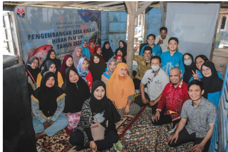
Gambar 5. Foto bersama peserta, tamu undangan dan panitia