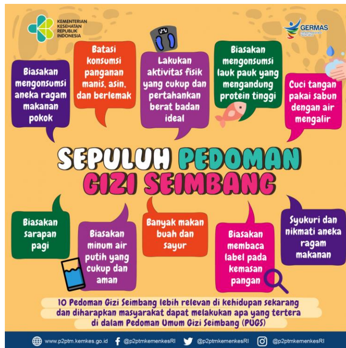
Gambar 2. Sepuluh pedoman gizi seimbang menurut Kementerian Kesehatan

Sulastri & Purwani, 2022). Pedoman gizi seimbang juga menekankan mengenai susu yang bukan menjadi peran penyempurna yang nyatanya dapat digantikan oleh jenis makanan lain yang memiliki nilai gizi yang sama, juga mengenai pentingnya memenuhi kebutuhan air mineral pada tubuh. Terjadinya stunting dipengaruhi oleh tingkat kerawanan pangan pada rumah tangga, kemiskinan, serta tidak baiknya sanitasi di lingkungan (Hapsari et al., 2018; Mukti et al., 2021; P2PTM Kemenkes RI, 2019).