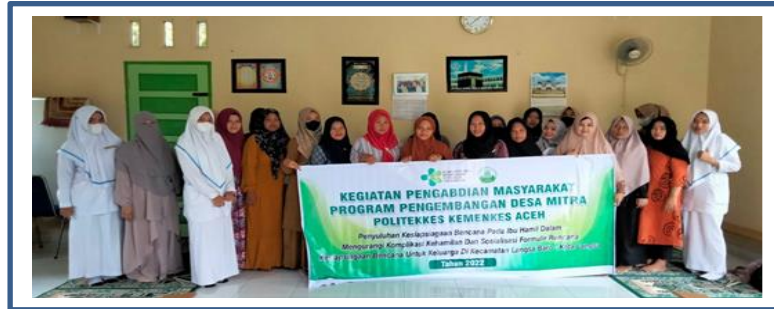
Gambar 2 : Kegiatan Penyuluhan Kesiapsiagaan Pada Ibu Hamil

dikenal sebagai negara rawan terjadi bencana. Sejak dini, kita perlu menyadari bahwa kita hidup di wilayah rawan bencana. Kenyataan ini mendorong kita untuk mempersiapkan diri, keluarga, dan komunitas di sekitar kita. Kesiapsiagaan diri diharapkan pada akhirnya mampu untuk mengantisipasi ancaman bencana dan meminimalkan korban jiwa, korban luka, maupun kerusakan infrastruktur (Prmono & Yusuf, 2015; Wahyuni, 2020).