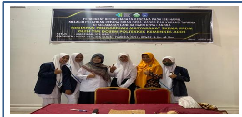
Gambar 3 : Pelatihan Kesiapsiagaan Pada Bidan, Kader dan Karang Taruna