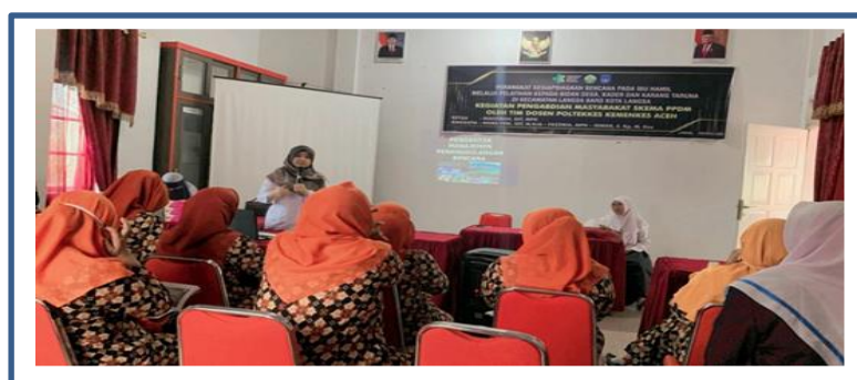
Gambar 4 : Pelatihan Kesiapsiagaan Pada Bidan