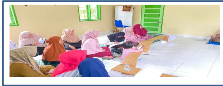
Gambar 5 : Pelatihan Kesiapsiagaan Pada Karang Taruna