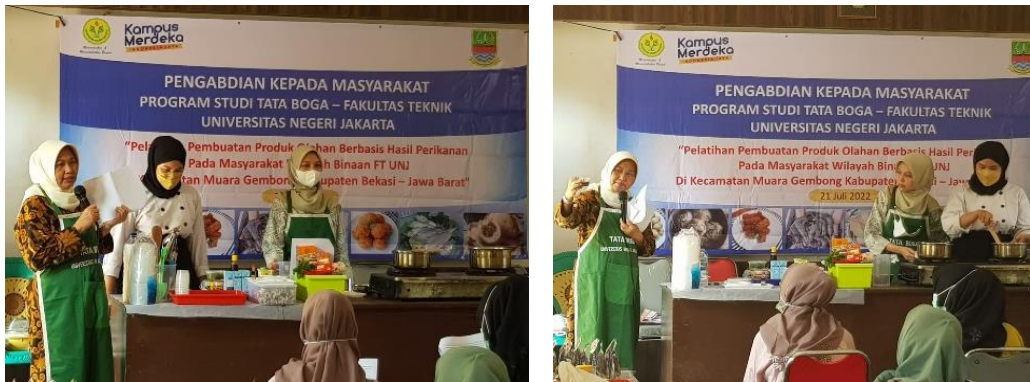
Gambar 2. Pemberian Materi dan Pembuatan Produk Pelatihan