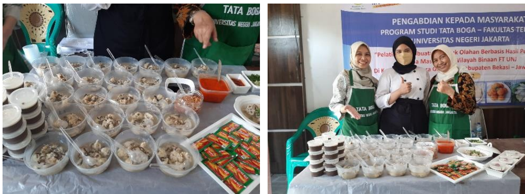
Gambar 3. Penyajian Produk Hasil Pelatihan

Berdasarkan perhitungan hasil penilaian pre-test dan post-test , terdapat peningkatan pengetahuan peserta kegiatan yang cukup signifikan. Nilai mean dari hasil pre-test adalah 83 dengan nilai modus 70 dan median 80. Hasil perhitungan nilai post-test didapatkan nilai mean sebesar 96 dengan nilai modus 100 dan nilai median 100. Berdasarkan perhitungan tersebut, dapat disimpulkan bahwa kegiatan pelatihan dan penyampain materi yang dilakukan oleh narasumber memberikan peningkatan terhadap pengetahuan peserta kegiatan.