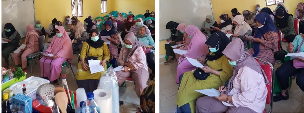
Gambar 1. Peserta Pelatihan Mengisi Pre-Test