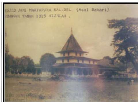
Foto 3. Hasil renovasi masjid Al-Karomah Martapura tahun 1315 H

Selain makam raja-raja ada juga makam ulama. Salah satu makam ulama yang cukup terkenal adalah Syekh Arsyad al-Banjari yang berada di Desa Palampayan. Syekh Arsyad al-Banjari lahir pada 1710 pada masa pemerintahan Sultan Hamidullah atau Sultan Kuning. Syekh Arsyad al-Banjari mendalami agama ke Mekkah selama sekitar