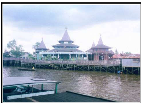
Foto 1. Masjid Sultan Suriansyah Banjarmasin dilihat dari seberang

berada di sepanjang tepian Sungai Martapura yang bermuara ke Sungai Barito. Pada beberapa tempat di sepanjang jalan itu terdapat peninggalan yang berkaitan dengan eksistensi Kerajaan Banjar, antara lain masjid, makam, serta sebuah sungai buatan yang dikenal dengan nama Sungai Kitanu. Nama Kitanu sesuai nama orang yang membuat sungai buatan tersebut, yaitu Ki Tanu yang diperkirakan hidup pada akhir abad ke-18 Masehi. Tokoh Ki Tanu dimakamkan tidak jauh dari sungai buatan tersebut.