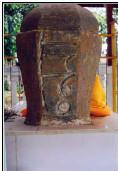
Foto 2. Nisan makam Sultan Sulaiman di Karang Intan, terdapat angka tahun 1230 H

Selain peninggalan makam, ada juga masjid besar yang sekarang dinamakan al Al-Karomah, yang berada di pusat kota Martapura. Masjid tersebut mungkin merupakan masjid kerajaan yang awalnya tidak berada di tempat tersebut. Dahulu, masjid tersebut diperkirakan berada di Kampung Pasayangan; yang dalam lukisan Belanda beratap tumpang tiga dan terletak di pinggir sungai besar (tampaknya Sungai Martapura). Masjid tersebut sudah berkali-kali dirombak, dan saat ini sudah dibangun dengan arsitektur modern, namun masih menyisakan beberapa tiang asli sebagai bukti peninggalan masa lalu (foto 3).