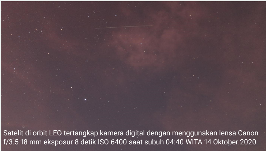
Satelit di orbit LEO tertangkap kamera digital dengan menggunakan lensa Canon f/3.5 18 mm eksposur 8 detik ISO 6400 saat subuh 04:40 WITA 14 Oktober 2020

atas ekuator Bumi dengan arah mengikuti arah rotasi Bumi, begitu pula periode orbitnya.