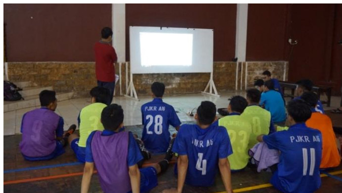
Gambar 3. Pemberian VFB dalam Pembelajaran Futsal