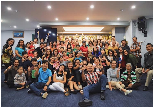
Gambar 1. Tim Pengabdian Kepada Masyarakat

Tabel di atas menunjukkan hasil post-test dengan 4 orang (57.14%) peserta berhasil mencapai nilai >70, yaitu 3 (42.84%) orang peserta dengan nilai 86.66, dan 1 orang (14.29%) peserta dengan nilai 73.33. Hasil ini menggambarkan tercapainya indikator keberhasilan kegiatan PkM, yaitu sebagian besar peserta memiliki nilai >70 untuk post-test .