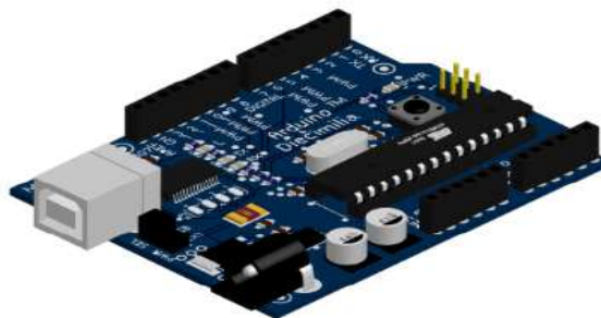
Gambar1. Arduino Board (Risal, 2017)

Arduino merupakan papan rangkaian sistem minimum mikrokontroler yang memang dirancang untuk dapat digunakan dengan mudah semua orang tanpaterkecuali orang Teknik (Risal, 2017). Sehingga arduino board dapat digunakan bagi semua orang yang ingin melakukan desain dan perancangan program tanpa mengetahui bahasa pemrograman, Arduino tetap dapat digunakan untuk menghasilkan karya yang canggih. Model Arduino yang biasa dijumpai disajikan pada gambar 1.