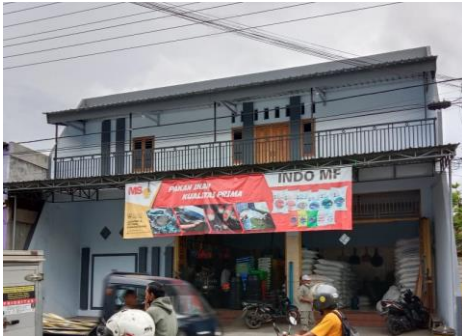
Toko Indo MF P.S tampak dari luar