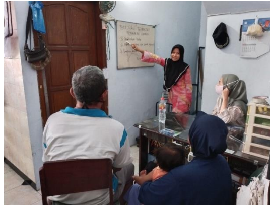
Gambar 1. Pelatihan hari pertama tentang pentingnya pemasaran online

merupakan pemilik dan pengelola Toko Indo MF P.S nampak antusias dan fokus dalam menerima materi serta menunjukkan keaktifan peserta dalam kegiatan diskusi dan tanya jawab setelah penyajian materi. Di akhir hari pertama pelatihan, peserta pelatihan diminta untuk menyiapkan konten marketing yang akan diunggah pada akun media sosial sebagai praktek untuk pertemuan selanjutnya. Konten yang dimaksud berupa foto, narasi/teks, video, dan sebagainya untuk keperluan marketing .