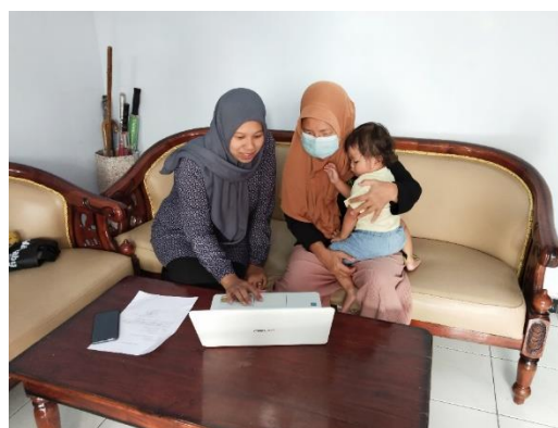
Gambar 2. Pelatihan Hari Kedua Tentang Pengenalan Media Sosial Dan Mendemonstrasikan Pembuatan Akun serta Unggah Konten Promosi

Setelah diadakannya pelatihan “Meningkatkan Penjualan Pakan Ikan dan Obat Ikan pada Toko Indo Multi Fish P.S Melalui Marketing Digital ” ini, diketahui beberapa hasil kegiatan pelatihan ini di antaranya: