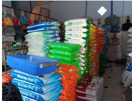
Beberapa produk yang dijual di Toko Indo MF P.S