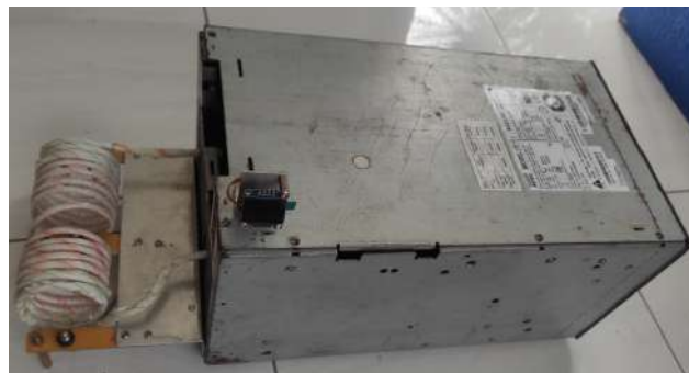
Gambar 5. Alat INTENSOR

Induction heater (Pemanas Induksi) salah satu teknik pemanas logam dengan memanfaatkan induksi elektromagnetik dari gelombang AC frekuensi tinggi, yang lebih efisien dari pada menggunakan tungku pemanas logam konvensional kelebihan dari tungku pemanas dengan sistem induction heater ialah : mudah dan efisien dalam pengontrolan suhu yang diinginkan, tidak ada pengaruh zat asam praktis terhadap susunan besi logam yang dipanaskan, karena tungku tidak lagi menggunakan bahan bakar fosil, tungku pemanas dengan sistem induction heater hanya membutuhkan energi listrik sebagai sumber energi utama yang mana listrik AC yang didapatkan umumnya yang hanya memiliki frekuensi 50-60 Hz akan dinaikan sampai frekuensi 100 KHz (Hakiki & Riandadari, 2018)