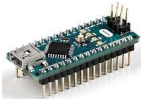
Gambar 3. Arduino Nano (Prastyo, 2019)

Arduino Nano adalah board microcontroller yang berukuran kecil, lengkap, dan salah satu board yang menggunakan IC ATmega328P (Arduino Nano V3). Ini memiliki fungsi yang kurang lebih sama dengan Arduino UNO , tetapi dalam packaging yang berbeda. Arduino Nano ini bekerja dengan kabel USB Mini-B dan bukan yang standar (Prastyo, 2019).