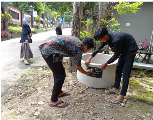
Gambar 4. Penyediaan Tempat Sampah

Pemberian fasilitas umum yakni tempat pembuangan sampah yang layak. Sehingga masyarakat tidak perlu membuang sampah pada aliran sungai dan beralih untuk membuang sampah pada tempat yang semestinya. Pada tahap ini dengan penyediaan sampah dengan mlakukan praktek membuang sampah pada tempatnya, diharapkan masyarakat mulai termotivasi dan terguhah untuk melakukan pembiasaan ini.