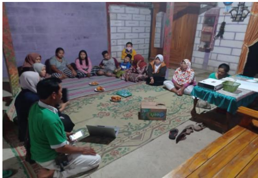
Gambar 3. Pemberian Materi Bahaya Limbah Plastik

Pelaksanaan aksi selama program pengabdian dibagi menjadi dua tahap yakni: 1) sosialisasi bahaya limbah plastik bagi habitat bulus 2) pemberian fasilitas tempat pembuangan sampah dengan layak. Catatan diskusi pada pemberian materi menunjukkan bahwa sebagian besar masyarakat sudah memahami bahaya dari limbah plastik bila termakan oleh hewan, namun masih ada sebagian yang belum mengetahui bahaya limbah plastik bagi ekosistem lingkungan dan kesehatan.