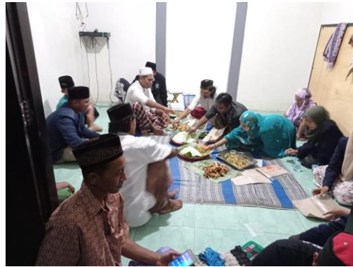
Gambar 2. Tahap PMPA bersama Karang Taruna

Pada tahap berikutnya pengabdian menyampaikan hasil pengumpulan data dan observasi pemetaan masalah kepada seluruh anggota Karang Taruna. Pada tahap ini dilakukan diskusi bersama dan merumuskan aksi yang akan ditunjukkan pada di warga desa Tawun bersama Karang Taruna Ketawang Tawun Jaya. Forum ini melakukan Analisa SWOT. Kekuatan; pihak desa dan karang taruna mendukung sepenuhnya dengan adanya KKN-BR. Kelemahan: singkatnya waktu dirasa kurang cukup bagi warga. Ancaman, warga yang memiliki kesibukan masing-masing akan susah untuk diajak berdiskusi bersama. Peluang: warga akan lebih terbantu jika kegiatan yang dilakukan berupa penyuluhan.