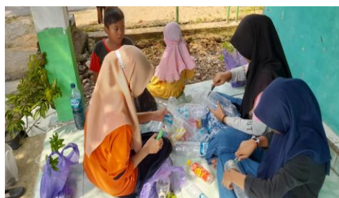
Gambar 4. Pembuatan Taman dengan Memanfaatkan Barang Bekas

Tim PKM menggunakan video animasi kartun karena sesuai dengan perkembangan anak-anak lebih tertarik dan fokus terhadap cerita yang disajikan dalam video tersebut.