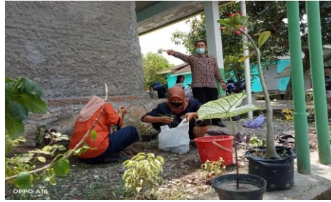
Gambar 5. Pembuatan Taman menggunakan Bahan Ramah Lingkungan