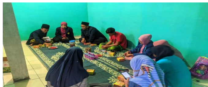
Gambar 1. FGD Tim PKM dengan Pengurus Madin Ula Al-Hadi

Data menunjukkan bahwa tingkat kebiasaan perilaku menjaga lingkungan di kalangan santri masih tergolong rendah sehingga diperlukan intervensi lanjutan dalam bentuk program pengabdian masyarakat. Berdasarkan hasil FGD yang dilakukan, santri Madrasah Diniyah Ula Al Hadi memerlukan pendampingan pembiasaan perilaku menjaga lingkungan. Pada pelaksanaannya, pengurus juga akan berkontribusi memberikan lahan untuk pembuatan taman yang menjadi salah satu program kegiatan, membawa tanaman dan menyediakan konsumsi. Sedangkan tim pengabdian dan santri menyediakan berbagai kebutuhan pembuatan taman secara gotong royong. Yaitu, tanaman, botol aqua bekas, cat, pupuk kompos dan peralatan berkebun yang diperlukan.