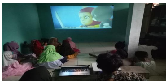
Gambar 3. Kegiatan Pendampingan Santri Madin Ula Al-Hadi

Kegiatan dilakukan selama 5 hari yaitu pada tanggal 14 – 23 maret 2022, dikarenakan tidak setiap hari masuk, pada hari Selasa dan Jumat libur jadi kegiatan dilakukan hingga tanggal 23 Maret 2022. Pada kegiatan penyampaian materi Tim Pengabdian menjelaskan pentingnya sikap dan tindakan menjaga lingkungan untuk keberlangsungan kehidupan berbagai pihak di bumi.