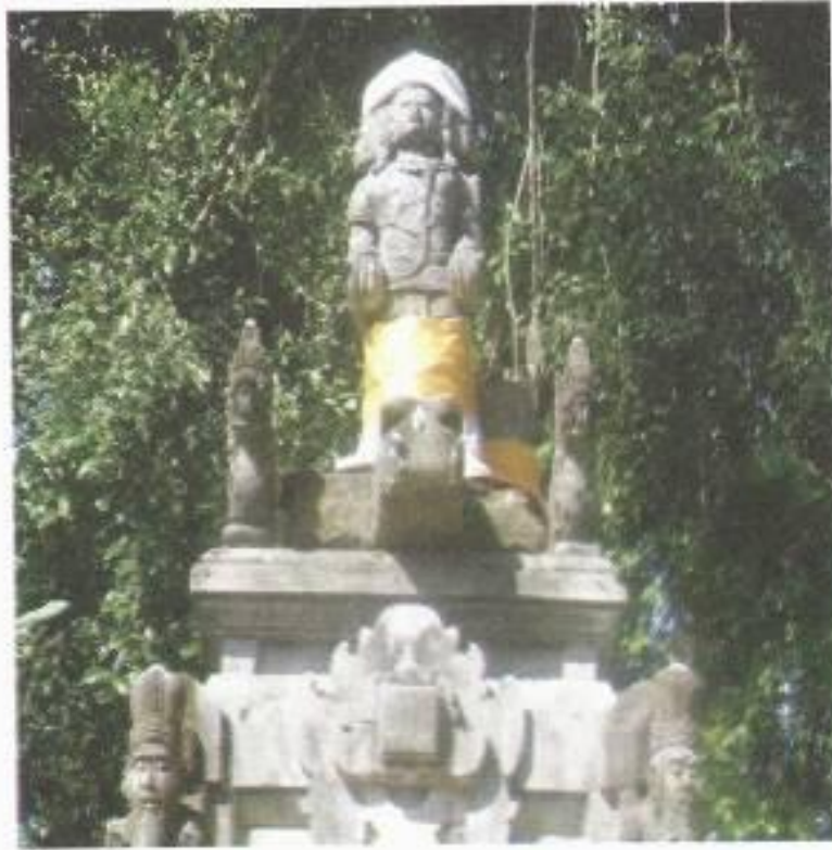
Foto no. 2 Arca Brahma (Catur Muka) di Pura Wasan, Desa Batuan Kaler, Sukawati Gianyar