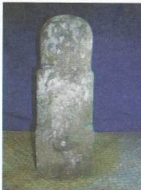
Foto no.3 Lingga di Pura Puseh Wasan, Batuan Kaler, Sukawati Gianyar

Lingga yang ditemukan cukup banyak tetapi yang dideskripsi hanya sebuah dengan kondisi yang baik. Lingga dan yoni ini ditempatkan pada sebuah pelingih yang disebut Gedong Segara, dan Lingga ini mempunyai ukuran tinggi 46 cm., dan lebar 18 cm (foto no. 3). Sedangkan Yoni di ditempatkan pada pelingih Catur Muka, di atas yoni ini ditempatkan arca Catur Muka.