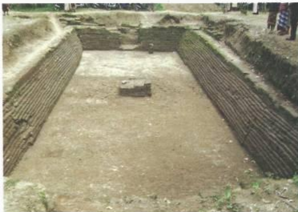
Foto no. 1 Kolam candi Wasan

Kolam yang ditemukan di candi Wasan berada di sebelah selatan candi, dan telah dapat dibuka secara keseluruhan yaitu bentuknya segi empat panjang dengan ukurannya sebagai berikut. Panjang 17,50 meter, lebar 7 meter, kedalaman 1,50 meter. Di tengah-tengah kolam ditemukan susunan batu padas dengan ukuran 1,50 x 1,50 meter, tinggi 80 cm. Susunan batu padas ini sudah terganggu dari bentuk aslinya yang tinggal bagian kecilnya saja. Kalau dilihat dari struktur yang masih ada, ketinggian paling tidak 2 meter lebih tinggi dari dinding kolam. Di atas dari struktur ini nampaknya ada benda sakral yang ditempatkan. Penempatan benda sakral tersebut juga berdasarkan hasil penelitian (deskripsi) tinggalan arkeologi yang ada di situs Wasan. Kolam ini memiliki sebuah tangga turun letaknya pada sisi dinding sebelah barat, dengan tiga anak tangga. Dinding kolam dibuat dari batu padas dengan sistem pemasangan berteras semakin ke bawah semakin menyempit. Kontruksi yang demikian itu sengaja dibuat untuk menjaga kekuatan dinding (Foto no.1).