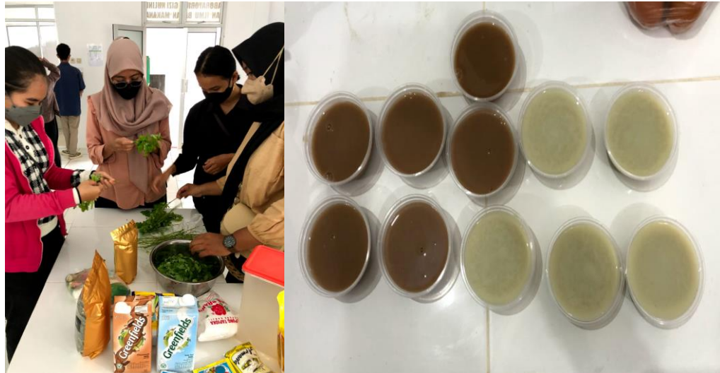
Gambar 3. Proses dan Hasil Fortifikasi Puding Daun Kelor

Setelah Kelompok Wanita Tani (KWT) Galuh Mandiri mengetahui manfaat daun kelor sebagai alternative pangan untuk mencegah stunting pada anak usia sekolah dasar, maka pengabdian melanjutkan kegiatan pengabdian dengan memberikan sosialisasi pembuatan daun kelor sebagai pudding dan sebagai cemilan yang disukai anak usia sekolah dasar. Kegiatan sosialisasi dilaksanakan di rumah Kepala RT 050 Kelurahan Guntung Manggis Kecamatan Landasan Ulin dengan pembagian leaflet dan presentasi, praktek pembuatan puding daun kelor oleh dosen Universitas Borneo Lestari.