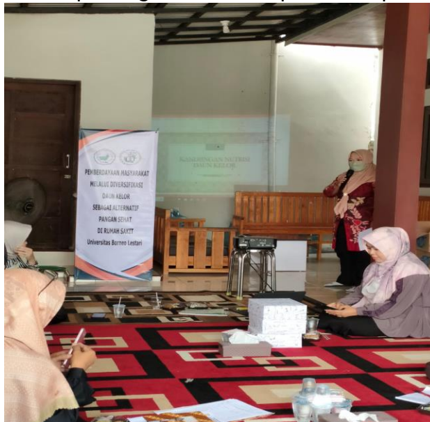
Gambar 2. Pengenalan Nutrisi Daun Kelor oleh Ahli gizi Puskesmas

Pengenalan manfaat kelor sebagai upaya pencegahan stunting pada anak usia sekolah melalui program penyuluhan dan edukasi ceramah oleh ahli gizi Puskesmas Landasan Ulin Timur tentang (a) pengenalan cara panen yang baik kelor dengan kualitas yang baik, (b) pengenalan kandungan dan manfaat yang ada pada kelor menggunakan data hasil penelitian (c) pentingnya mencegah stunting pada anak usia sekolah sejak dini (Gambar 2). Hasil pembuatan pudding daun kelor dilakukan dengan metode pengenalan dengan menunjukkan prosedur pembuatan melalui metode ceramah, pemberian leaflet dan praktek secara langsung. Proses dan hasil dari pembuatan pudding daun kelor dapat dilihat pada (gambar 3).