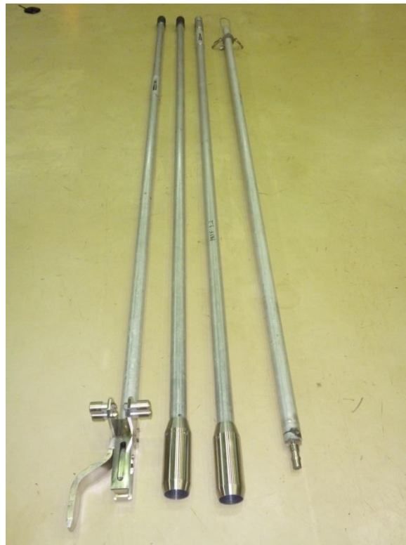
Gambar 2. Alat bantu PRTF 1.1, PRTF 1.2, PRTF 1.3 dan PRTF 1.4