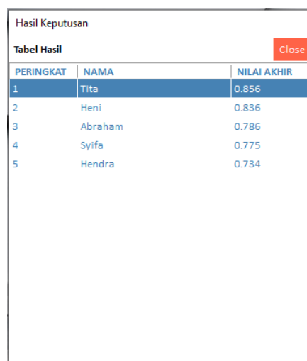
Gambar 3. Tampilan halaman hasil keputusan