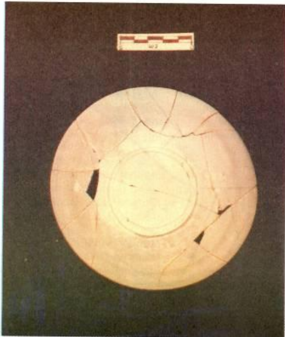
Foto 1 : Mangkok warna putih dari Cina, masa Dinasti Sung (Abad 10-12 M).