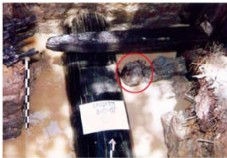
Gambar 3. Tiang kayu utuh yang dibentuk lancip untuk bagian yang menancap di tanah.