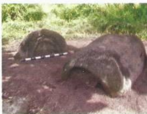
Foto no. 8. Wadah bejana batu situs Donggo, Bima