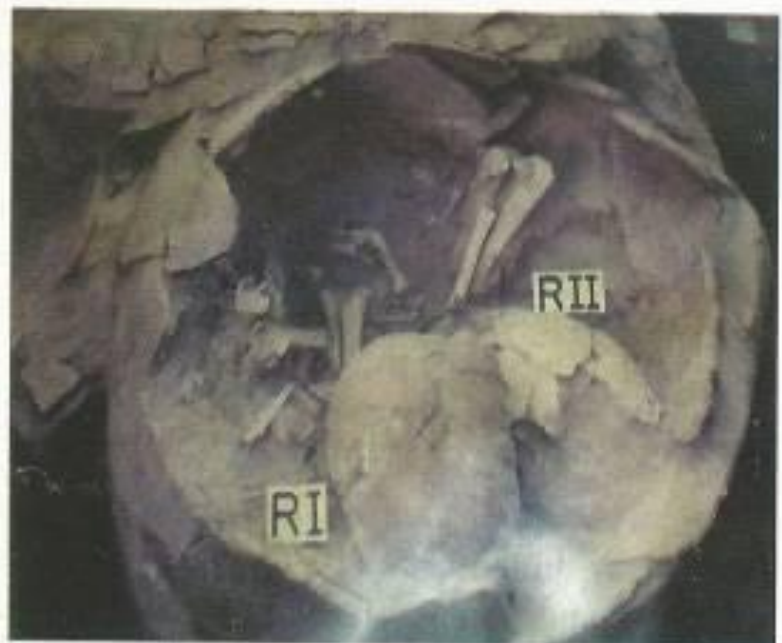
Foto no. 2 Kubur tempayan Lambanapu, NTT.

masa berkembangnya tradisi megalitik yang tinggalan dipemukiman maupun penguburannya, dapat ditemukan dalam suatu lokasi. Hasil temuan kapak neolitik di kabupaten Dompu tidak sekaya yang ditemukan di pulau Jawa, bahkan di Jawa tinggalan masa neolitik yang merupakan hasil teknologi Austronesia dapat dijumpai di satu lokasi seperti di kawasan Pacitan (Punung),