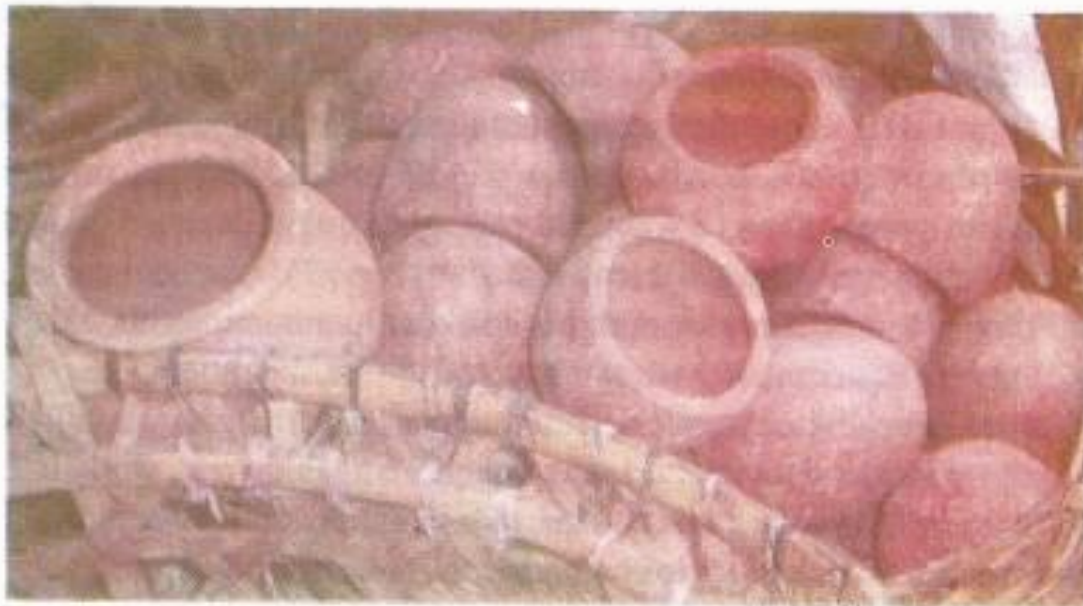
Foto no. 3. Gerabah salah satu hasil industri rumah tangga masyarakat Dompu

teknologi pembuatan gerabah, teknologi alat besi, dan lain-lain. Hasil budaya Austronesia dengan tinggalan pemukiman dan penguburan dengan hasil tradisi gerabah yang menonjol seperti yang ditemukan di pulau Sumatra, Jawa dan Bali, diduga memiliki arti penting munculnya tinggalan gerabah di situs Nangasia.