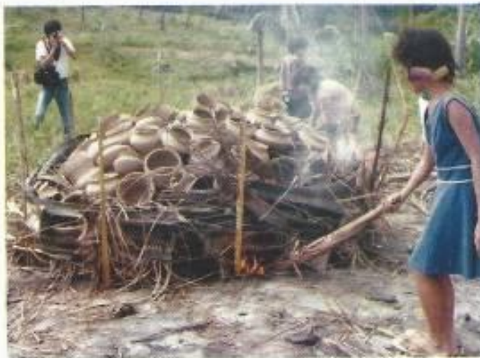
Foto no. 4. Pembakaran grabah di Philipina, dengan cara tradisional, hanya menggunakan daun kelapa kering

Pengetahuan dan teknologi pembuatan benda gerabah merupakan perpaduan dari kemahiran analisis bahan, kemahiran pembuatan, kemahiran pembakaran, dan lain-lain yang diperkirakan dilakukan oleh satu pendukung budaya yang bersifat turun temurun yang dalam hal ini adalah bangsa Austronesia yang bermigrasi pada masa bercocok tanam dan masa perunggu-besi. Teknologi pembuatan benda gerabah yang tertua adalah teknik buatan tangan ( hand made ), yaitu pembuatan gerabah tanpa menggunakan roda pemutar. Benda gerabah yang dibuat dengan cara ini tidak memiliki bekas roda pemutar ( striation ). Sedangkan pembakaran tampaknya belum mempergunakan tanur atau pembakaran dengan cerobong, tetapi dilakukan dengan mempergunakan