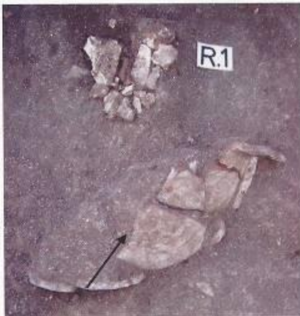
Foto no. 5. Gerabah Nangasia sebagai wadah kubur dan bekal kubur

tidak sadar diturunkan oleh nenek moyang yaitu bangsa Austronesia kepada keturunannya di wilayah tersebut. Penggalian yang dilakukan di pantai (situs) Nangasia telah dapat menemukan sisa-sisa penguburan dalam bentuk rangka manusia, sehingga nantinya dapat diketahui siapa pendukung budaya pantai Nangasia tersebut. Dari berbagai tinggalan bentuk rangka yang ditemukan di situs Belubus (Sumatra Barat), situs Anyar (Jawa Barat), situs Plawangan (Jawa Tengah) dan situs Gilimanuk (Bali) menunjukkan bukti-bukti, ras Mengoloid. Temuan berbagai macam tinggalan gerabah dalam bentuk cobek, tempayan, mangkok, cawan yang disusun secara teratur, posisi berjajar lurus jelas menunjukkan adanya aktivitas penguburan atau pemujaan. Bekal kubur yang ada di situs gerabah diberbagai tempat di Indonesia dapat menjadi bukti, bahwa gerabah Nangasia di samping juga sebagai bekal kubur dan sebagai wadah kubur (tulang dalam tempayan) (Foto no.5).