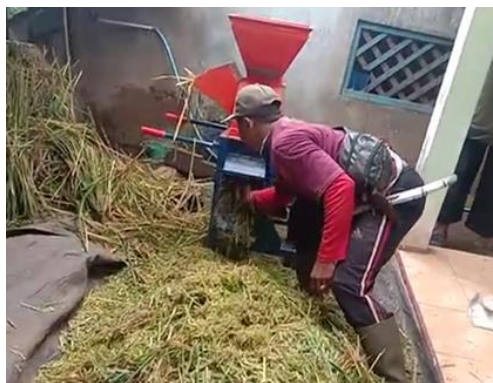
Gambar 4. Uji fungsional mesin pencacah

Uji coba operasional dilakukan pada 2 ekor domba, yaitu domba kontrol dan domba uji, selama 28 hari. Domba kontrol diberi pakan hijauan segar tanpa dicacah, sedangkan domba uji diberi pakan yang dicacah dengan mesin pencacah. Bobot kedua ekor domba ditimbang sebelum dan sesudah masa pengujian. Bahan pakan segar ditimbang setiap hari dan dijumlahkan selama pengujian. Hasil langsung dari introduksi mesin ini adalah menurunnya kebutuhan bahan pakan ternak hijauan sampai 35%. Hal ini dikarenakan pakan sisa pada domba uji lebih sedikit dibanding dengan domba kontrol, atau bahkan hampir tidak ada sisa. Tabel 2 menunjukkan hasil uji coba operasional yang dimaksud.