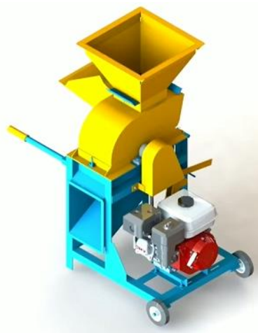
Gambar 1. Model 3D dari mesin pencacah

Selanjutnya, dilakukan desain mesin pencacah pakan ternak. Gambar 1 menunjukkan model 3D dari mesin pencacah. Desain mesin pencacah didiskripsikan sebagai berikut. Rangka: dibuat dari baja profil agar ringan (mudah dipindahkan) dan ekonomis, dilengkai dengan roda dan handel yang bisa disembunyikan. Pisau potong: terdiri dari dua jenis mata potong, yaitu mata potong shear dan mata potong hammer yang dibuat tajam. Mata potong shear : terdiri dari 3 buah, ditempatkan pada meja yang berbentuk cakram, pada dibuat dari bahan HSS, berputar pada sumbu horizontal. Sedangkan pisau hammer , terdiri dari tiga kelompok yang masing-masing kelompok terdiri dari 4 pisau tajam, sehingga bisa digunakan untuk memotong bahan pakan keras. Pisau hammer didesain khusus agar lebih tahan terhadap gaya sentrifugal dan benturan. Hal ini dilakukan untuk mengurangi patahnya pisau hammer pada bagian pangkal yang berupa lasan, sehingga meningkatkan keamanan, sebagaimana juga terlihat pada Gambar 2. Hoper dan corong keluar: terdiri dari dua hoper dan tiga corong keluar. Transmisi: sabuk V. Mesin penggerak: motor bensin, Honda GX 200, 200 CC. Keamanan: penutup belt ditambahkan untuk meningkatkan kemanan mesin. Kapasitas mesin: kapasitas mesin pencacah adalah 500 kg per jam.