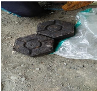
Gambar 5. Pavin Block siap finishing

Media sosial berperan mendukung kegiatan pemasaran produk perusahaan, mengurangi biaya produksi dan memiliki lingkup yang luas (Romdonny, & Rosmady, 2018). Penggunaan media sosial jejaring Faceook sangat diperlukan oleh mitra untuk meningkatkan jangkauan pemasaran produk pavin block. Faktor penghambat pemasaran hasil produksi organisasi bisnis adalah kurangnya pemanfaatan teknologi informasi dan infrastruktur (Kurniawan, & Fauziah, 2014; Putra, 2015; Sulisty, 2010). Manfaat penggunaan media sosial pada organisasi bisnis berpengaruh sangat signifikan dalam hal meningkatkan jumlah pesanan penjualan (Romdonny, & Rosmady, 2018).