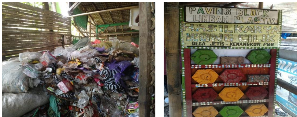
Gambar 3. Sampah plastik dan Pavin Block hasil produksi Kelompok Lestari Bumi

Peserta pelatihan diberi kesempatan untuk bertanya tentang materi yang sudah disampaikan agar transfer pengetahuan berhasil dan peserta bertambah wawasannya. Dilanjutkan dengan pemateri memandu peserta untuk mempraktikkan materi yang sudah disampaikan. Setelah itu dilakukan pendampingan dengan pemateri memberikan kesempatan pada peserta untuk melakukan pendampingan selama diperlukan berkaitan dengan materi yang sudah dipraktikkan peserta.