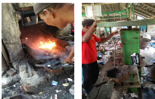
Gambar 4. Proses produksi Pavin Block sampah plastik

Peserta pelatihan diberi kesempatan untuk bertanya tentang materi yang sudah disampaikan agar transfer pengetahuan berhasil dan peserta bertambah wawasannya. Dilanjutkan dengan pemateri memandu peserta untuk mempraktikkan materi yang sudah disampaikan. Setelah itu dilakukan pendampingan dengan pemateri memberikan kesempatan pada peserta untuk melakukan pendampingan selama diperlukan berkaitan dengan materi yang sudah dipraktikkan peserta.