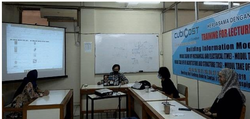
Gambar 4. Pembahasan hasil rancangan bersama tim inti.