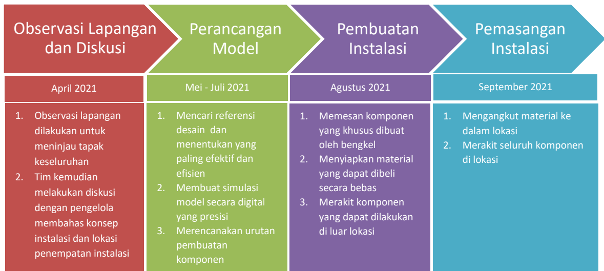
Gambar 1. Metode pelaksanaan usulan kegiatan pengabdian kepada masyarakat.

komponen yang dapat dilakukan di luar lokasi. Tim pendukung terdiri dari mahasiswa sebanyak enam orang. Pada tahap terakhir, yaitu pengangkutan material ke lokasi dan perakitan seluruh komponen di lokasi. Tim pendukung melibatkan sebagian masyarakat di Kampung Keranggan untuk terlibat dalam pemasangan ini. Pada tahap ini pula diadakan acara peresmian.