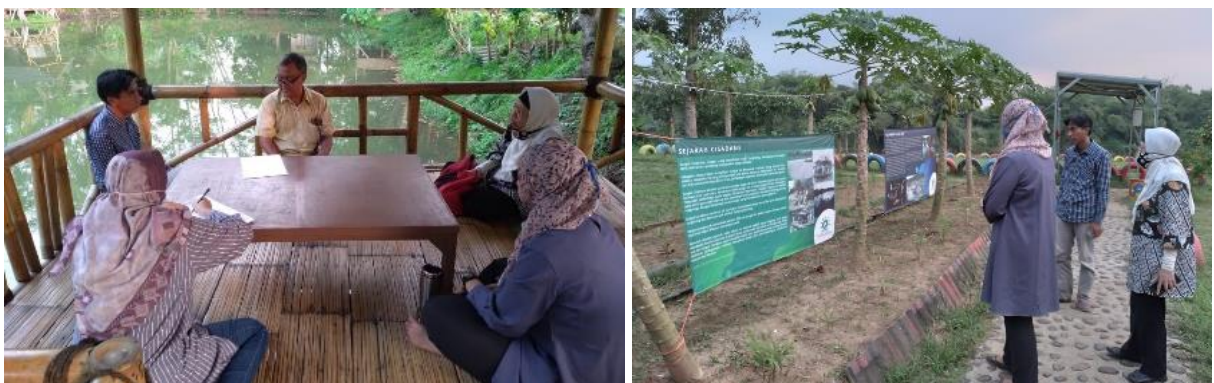
Gambar 2. Diskusi dan pengamatan tapak langsung.

Penentuan lokasi penempatan instalasi dilakukan antara tim pengabdian masyarakat dengan ketua kelompok sadar wisata Kampung Kranggan. Dari hasil diskusi dan pengamatan langsung pada tapak (Gambar 2), lokasi yang ditentukan berada di bagian selatan area perkemahan Kampung Keranggan. Instalasi direncanakan untuk diletakkan dengan arah pandang ke arah barat daya dengan pemandangan berupa sungai Cisadane.