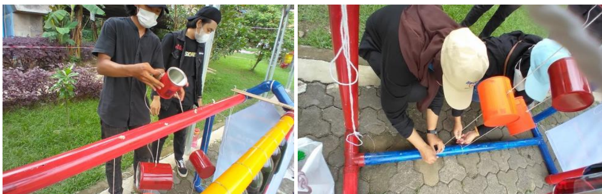
Gambar 5. Perakitan Instalasi

Impelementasi kegiatan pemasangan instalasi dilakukan pada hari sabtu tanggal 16 Oktober 2021 pukul 10.00 WIB. Kegiatan tersebut berlangsung di sudut ruang publik pada Kampung Keranggan, dihadiri sekitar 36 orang, yang terdiri dari 5 orang Tim Pengabdian masyarakat Institut Teknologi Indonesia, 7 orang mahasiswa, 4 anggota pokdarwis, dan 20 orang warga Kampung Keranggan. Perakitan instalasi dilakukan bersama sama oleh mahasiswa dan anggota Pokdarwis (Kelompok Sadar Wisata).