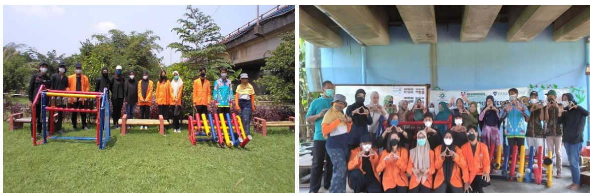
Gambar 6. Serah terima instalasi kepada Pokdarwis Kampung Keranggan.

Setelah instalasi tersusun, maka sesi selanjutnya adalah serah terima kepada pihak Pokdariws Kampung Keranggan. Instalasi tubulum dan xylophone diletakan sesuai dengan titik lokasi yang telah ditentukan. Hasil kegiatan pengabdian masyarakat ini cukup diterima oleh mitra dibuktikan dengan antusiasme warga yang menyambut saat kegiatan dan beberpaa warga yang mencoba langsung memainkan instalasi tersebut.