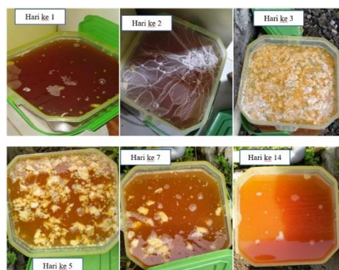
Gambar 3. Proses fermentasi hari 1 – hari 14

Pada tahap persiapan, proses fermentasi membutuhkan waktu 14 hari untuk dapat siap digunakan (Gambar 3). Pengaplikasian POC dapat dilakukan secara langsung disiramkan pada tumbuhan dengan melakukan proses pengenceran 1:10 terlebih dahulu.