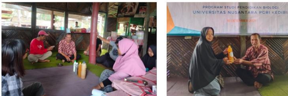
Gambar 4. Pelaksanaan sosialisasi dan penyerahan simbolis POC pada ketua Paguyuban PK5

Pada tahap pelaksanaan diawali dengan kegiatan sosialisasi tentang jenis tanaman dan hubungannya dengan kupu-kupu disampaikan selama kurang lebih 40 menit pemaparan dan 20 menit diskusi (gambar 4). Kegiatan ini dapat meningkatkan pemahaman bagi warga desa Irenggolo yang tergabung dalam PK5 Sokowono tentang pentingnya memelihara tanaman berbunga di kawasan wisata. Peningkatan pemahaman ini diukur dari adanya banyak pertanyaan tentang jenis-jenis tanaman yang sesuai untuk ditanam di kawasan ini, cara menanam, dan perawatannya. Ada juga pertanyaan tentang kupu-kupu yang jumlahnya mulai menurun. Tim pengabdian menampung semua pertanyaan dan menjawab dengan seksama, termasuk pertanyaan tentang mengapa jumlah kupu-kupu justru menurun pada saat tidak banyak pengunjung.