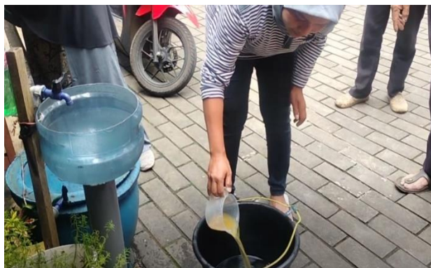
Gambar 5. Salah satu peserta mempraktikkan pengenceran POC

Pada tahap monitoring, sebagai tindak lanjut dari kegiatan ini, peserta mengharapkan ada control dari tim pengabdi agar tanaman-tanaman yang disarankan untuk ditanam dapat segera ditanam dan dirawat. Oleh sebab itu, tim melakukan control selama dua bulan pertama dengan durasi kunjungan setiap seminggu sekali. Hal ini dilakukan juga untuk melihat kemajuan proses pembuatan POC secara mandiri oleh warga. Adapun beberapa kendala yang diapami selama melakukan kegiatan hingga tahap monitoring disajikan dalam tabel 2.