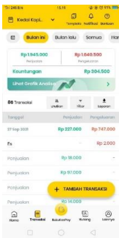
Gambar 1. Penerapan pengelolaan keuangan berbasis aplikasi pada Mitra

Tahapan pelatihan ini berfokus pada pembuatan media pemasaran digital berupa website sederhana serta pembuatan konten untuk media sosial menggunakan aplikasi CANVA. Pelatihan ini didasarkan pada keinginan yang disampaikan oleh mitra untuk dapat melakukan pengembangan dalam proses pemasaran digital bagi kedai kopi Garasi. Mitra menuturkan bahwa selama ini kegiatan pemasaran yang dilakukan masih sebatas melalui whatsapp maupun instagram story dan konten yang dihadirkan pun masih berupa foto biasa. Mitra berharap dapat mengembangkan bentuk pemasarannya salah satu menggunakan media website namun kendala yang dihadapi ialah kesulitan untuk melakukannya dan biaya yang cukup besar untuk melakukan pengurusan domain dan hosting.