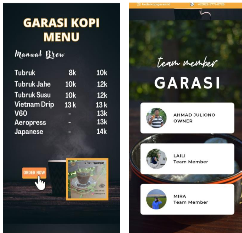
Gambar 4. Menu Digital Kedai Kopi Garasi

daring dikarenakan bentuk pelatihan yang disertai dengan praktik dan masih minimnya informasi mengenai pengelolaan keuangan dan pelatihan media pemasara digital dengan CANVA. Hal ini tentunya menjadi tidak maksimal bila harus dilangsungkan secara daring.