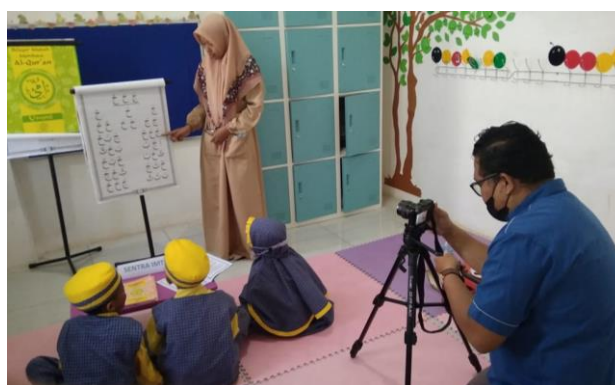
Gambar 2. Proses Shooting

Tahap kedua dilakukan pada bulan Juni 2021 yang melibatkan pihak sekolah untuk melakukan simulasi proses belajar mengajar. Hal tersebut dilakukan karena pada periode tersebut, di saat pandemi proses belajar mengajar sejatinya dilakukan secara daring. Sebagai efek dari tahap pertama yang telah memetakan CA dari sekolah, maka proses shooting dapat dilakukan dengan sangat efisien, yakni satu hari kerja. Sedangkan proses finishing yang didalamnya meliputi proses edit dan rendering dilakukan dalam waktu 1 minggu.