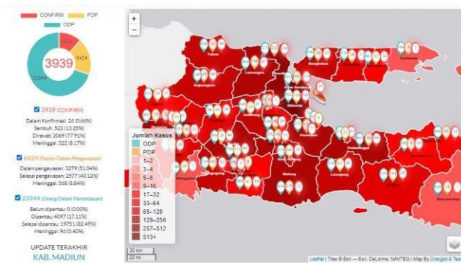
Gambar 1. Peta Sebaran Covid-19 Provinsi Jawa Timur

Penambahan kasus positif di Indonesia mulai melaju cepat sejak 6 April yakni sekitar 200-300 orang per hari, lalu bergerak naik 300-400an kasus baru per hari dan kini hampir mencapai 500 kasus baru per hari. Kasus positif virus corona di Indonesia terus bertambah, menembus 23.000 orang. Penambahan kasus baru terbanyak sebelumnya terjadi di Jakarta, Jawa Timur, dan Jawa Barat. Sementara pada awal pekan ini penambahan kasus baru terbanyak terjadi di Jakarta, Jawa Timur, dan Sumatera Selatan.