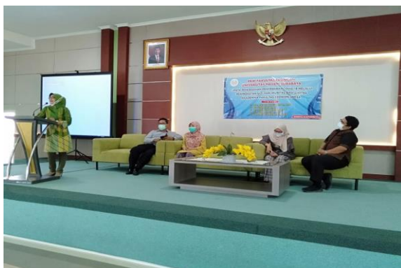
Gambar 3. Edukasi Gerakan 5 M dan MIO

Berdasarkan hasil observasi tersebut maka tim kami merencanakan kegiatan untuk memberikan edukasi kepada seluruh tenaga kependidikan di lingkungan Fakultas Ekonomi Unesa untuk menerapkan protokol kesehatan secara benar serta membiasakan untuk mengonsumsi multivitamin dan asupan bergizi untuk menjaga dan meningkatkan imun tubuh. Pelaksanaan PKM dimulai dengan mengadakan kegiatan edukasi atau penyuluhan kepada tenaga kependidikan di lingkungan Fakultas Ekonomi Unesa terkait dengan tata cara penerapan protokol kesehatan dan pembiasaan untuk mengonsumsi multivitamin dan asupan makanan bergizi guna meningkatkan daya tahan tubuh (imun) selama bekerja di kantor. Kegiatan ini dibuka oleh Dekan Fakultas Ekonomi Unesa dan diikuti oleh seluruh tenaga kependidikan di lingkungan Fakultas Ekonomi Unesa sejumlah 40 orang baik tenaga kependidikan PNS, Non PNS dan tenaga outsourcing .