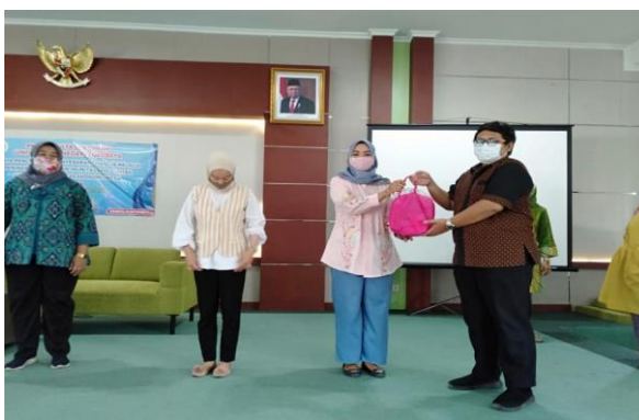
Gambar 6. Pemberian Bantuan Multivitamin Kepada Tendik FE Unesa

Selain itu berdasarkan hasil angket respon yang diberikan dapat diketahui bahwa sebanyak 100% peserta memberikan respon positif dari adanya kegiatan PKM ini, hal ini terlihat dari respon mereka bahwa kegiatan edukasi protokol kesehatan dan terapi imun ini memberikan manfaat bagi mereka serta mampu memenuhi kebutuhan mereka akan informasi terkait untuk tata cara menjaga kesehatan dan meningkatkan imunitas melalui konsumsi asupan makanan bergizi dan multivitamin sehingga mereka nantinya merasa aman dan nyaman saat menjalankan tugas di kantor selama pandemi Covid-19 serta sebagai tindakan preventif untuk pencegahan agar mereka tidak mudah terjangkit virus corona.