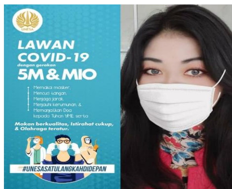
Gambar 4. Pamflet Gerakan 5 M dan MIO

Setelah itu acara dilanjutkan dengan kegiatan terakhir yaitu edukasi terapi imun yang dilakukan oleh Ketua Tim PKM dengan memberikan informasi tentang pentingnya mengonsumsi makanan yang bergizi dan multivitamin sebagai upaya untuk meningkatkan imunitas tubuh. Peserta diberikan informasi dan pengetahuan terkait bagaimana cara yang dapat dilakukan untuk meningkatkan kekebalan tubuh (imunitas) sesuai dengan hasil riset atau penelitian dalam jurnal – jurnal ilmiah. Kemudian mereka diminta untuk mempraktikkan selama dua minggu kedepan agar rutin mengonsumsi multivitamin, susu, madu, sereal dan makanan bergizi lainnya. Untuk membantu peserta dalam menerapkan terapi imun ini tim kami juga memberikan bantuan berupa paket multivitamin dan asupan penambah imun berupa susu, madu, sereal dan biskuit yang nantinya akan dikonsumsi selama dua minggu kedepan. Pemberian bantuan ini bertujuan untuk meningkatkan imun mereka selama WFO sehingga tidak mudah terjangkit Covid-19.