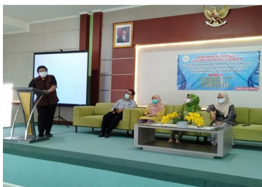
Gambar 5. Edukasi Terapi Imun

Setelah itu acara dilanjutkan dengan kegiatan terakhir yaitu edukasi terapi imun yang dilakukan oleh Ketua Tim PKM dengan memberikan informasi tentang pentingnya mengonsumsi makanan yang bergizi dan multivitamin sebagai upaya untuk meningkatkan imunitas tubuh. Peserta diberikan informasi dan pengetahuan terkait bagaimana cara yang dapat dilakukan untuk meningkatkan kekebalan tubuh (imunitas) sesuai dengan hasil riset atau penelitian dalam jurnal – jurnal ilmiah. Kemudian mereka diminta untuk mempraktikkan selama dua minggu kedepan agar rutin mengonsumsi multivitamin, susu, madu, sereal dan makanan bergizi lainnya. Untuk membantu peserta dalam menerapkan terapi imun ini tim kami juga memberikan bantuan berupa paket multivitamin dan asupan penambah imun berupa susu, madu, sereal dan biskuit yang nantinya akan dikonsumsi selama dua minggu kedepan. Pemberian bantuan ini bertujuan untuk meningkatkan imun mereka selama WFO sehingga tidak mudah terjangkit Covid-19.