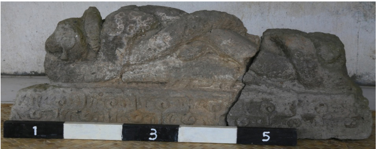
Gambar 2. Relief naga Pura Subak Wasan.

1972, 59). Disebutkan dalam Sudamani, bahwa lingga itu adalah sebagai lambang pemujaan terhadap Trimurti , yaitu Brahma, Wisnu, dan Siwa, serta yoni-nya adalah lambang bhumi atau dunia materi. Temuan sekitar Pura Subak Wasan menunjukkan adanya relevansi dengan temuan lainnya seperti candi, yang ternyata dapat difungsikan sebagai stana Dewa Siwa. Dalam kaitannya dengan pendirian bangunan suci, terutama di Situs Wasan, sumber mata air atau tirtha adalah syarat mutlak dari suatu bangunan suci (Kramrisch 1946, 5). Dengan demikian, adanya kolam di Situs Wasan mengacu juga pada konsep tersebut, selain dari situasi Situs Wasan sekarang yang lokasinya berdekatan dengan sumber air. Kolam tersebut merupakan tempat penampungan air, sekaligus difungsikan dalam proses penyelesaian upacara di pura bersangkutan. Rupanya tanpa air atau tirtha , upacara belum bisa terlaksana dalam persembahyangan. Apabila belum diperciki air suci, rasanya pikiran belum merasa damai, bersih, atau suci. Dengan demikian, air kolam tersebut mempunyai peranan sebagai pembersih dan penyucian lahir batin. Keberadaan relief naga di Pura Subak Wasan tidak terlepas juga dengan tanah, air, dan bumi, karena dari bumi segala sesuatu lahir karena bumi diyakini sebagai sumber kesuburan. Karena itulah naga juga sebagai simbolisasi bumi dan simbol