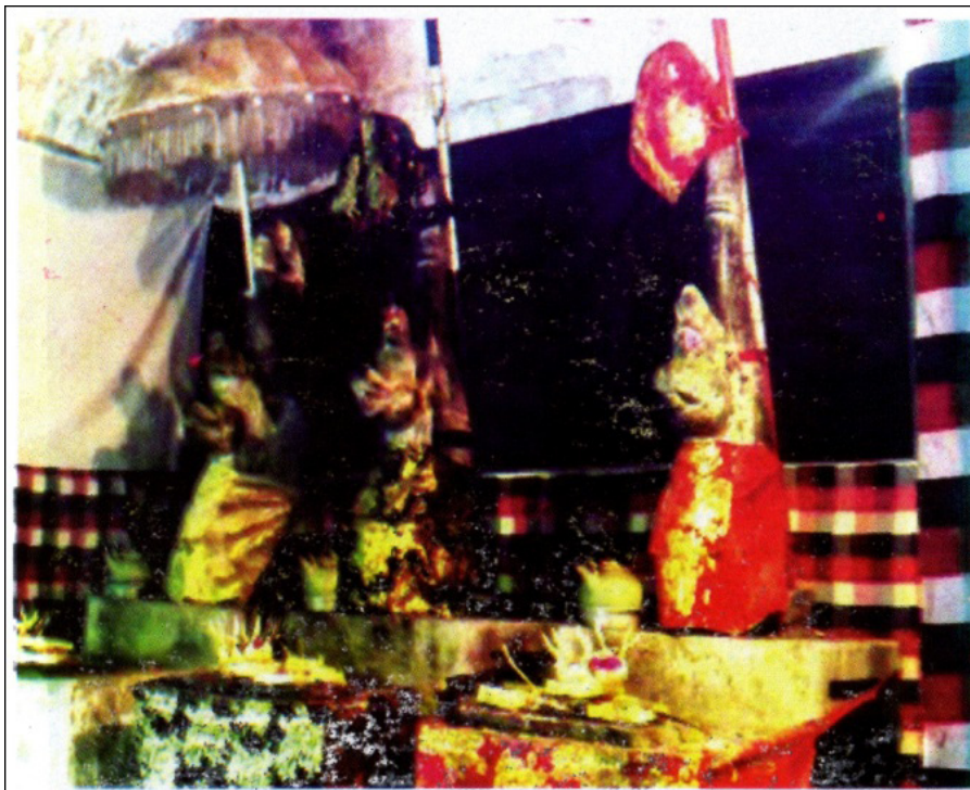
Gambar 3. Arca Naga Anantabhoga, arca Naga Basuki dan arca Naga Taksaka, di Pura Goa Raja, Besakih.