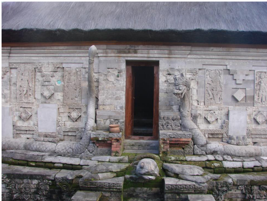
Gambar 4. Arca Naga di Pura Taman Sari Klungkung.

Di kompleks Candi Penataran, yakni pada halaman tengah, terdapat bangunan yang disebut dengan Candi Naga. Candi ini hanya tersisa pada bagian kaki dan badannya saja. Nama Candi Naga digunakan untuk menamakan bangunan ini karena tubuh candi dililit oleh relief naga dan disangga oleh tokoh-tokoh berbusana raya, seperti raja sebanyak sembilan buah. Masing-masing tokoh ini berada di sudut-sudut bangunan, bagian tengah ketiga dinding, serta di sebelah kiri dan kanan pintu masuk. Salah satu tangan tokoh ini memegang genta atau lonceng upacara dan tangan yang lainnya menopang tubuh naga yang melingkar di bagian atas bangunan, dalam keadaan berdiri, serta menjadi pilaster bangunan. Tokoh-tokoh dan relief naga yang ditampilkan di Candi Penataran, terutama Candi Naga, mengingatkan dengan mitologi Samudramanana. Candi tersebut diibaratkan Gunung Mahameru atau Gunung Mandara