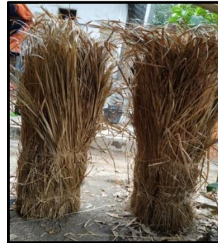
Gambar 2. Selembah re .

lingkaran, para tukang kayu memiliki istilah ukuran 25 bunder . Maksud dari 25 bunder ini adalah bahan kayu dengan bentuk tabung yang memiliki diameter 25 centimeter. Selain bahan kayu yang dibutuhkan dalam pembuatan bale lumbung, kebutuhan bahan lain yaitu rumput ilalang kering ( re ) baik yang telah berupa atap maupun berupa ikatan rumput kering. Re yang telah berbentuk atap ini biasa diperlukan sebanyak 200 lembar, hal ini tergantung dari besarnya bale lumbung yang dibuat. Rumput ilalang kering yang diperlukan untuk sebuah bale lumbung sebanyak tiga ikatan ( selembah sepoto ). Selembah yang dimaksudkan ini adalah dua ikat sedangkan sepoto merupakan satu ikat ilalang kering.