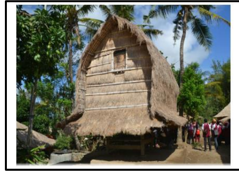
Gambar 1. Bale Lumbung Sasak Tradisional.

belajar matematika di sekolah yang menyebabkan pembelajaran matematika lebih menarik dan bermakna bagi siswa (Lisnani dkk., 2020). Adapun bentuk bale lumbung menurut Sudadi (2018) yaitu sebagai berikut.