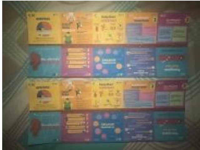
Gambar 3: Flyer