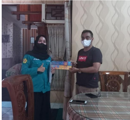
Gambar 1- Intervensi Kesehatan Kepada Keluarga

Hipertensi. Setelah pemaparan selesai, selanjutnya penulis memberikan Flyer tersebut, serta menjelaskan secara singkat isi dari flyer tersebut dengan menampilkan E-flyer melalui laptop. Kemudian dilakukan post-test dan salam penutup