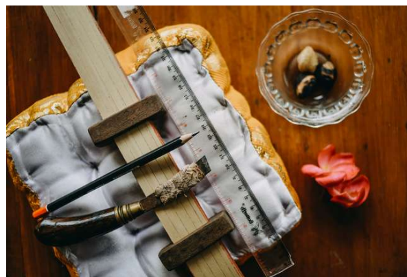
Foto 2. “Alat dan Bahan Penulisan lontar”, 2022

Pada foto ini memperlihatkan alat-alat dan bahan penulisan naskah lontar. alat-alat tersebut meliputi: pengerupak (pisau tulis), pelikan (alat penjepit lembaran lontar yang akan ditulis), pensil, penggaris, dan bantal kasur kecil sebagai alas menulis. Bahan dalam penulisan lontar meliputi: pepesan (daun tal siap tulis), serbuk tingkih (buah kemiri) atau buah naga sari yang dibakar sebagai bahan penghitam goresan aksara Bali, bantal kasur kecil sebagai alas menulis.