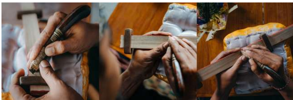
Foto 3. “Proses Mengerupak”, 2022

Pada proses ini pengawi sudah mulai menulis naskah lontar di atas rontal menggunakan pengerupak (pisau tulis). Terlihat di dalam foto detail dari tangan pengawi yang sedang menulis dan cara memegang pisau tulis. Dalam melakukan penulisan tidak boleh terlalu dalam agar tidak membuat rontal berlubang.