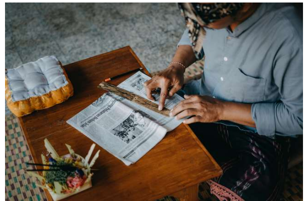
Foto 4. “Proses Penghitaman”, 2022

Setelah proses penulisan selesai tahapan selanjutnya adalah proses penghitaman seperti terlihat pada foto. Proses penghitaman menggunakan bahan buah kemiri yang sudah di bakar lalu di oleskan pada goresan lontar.