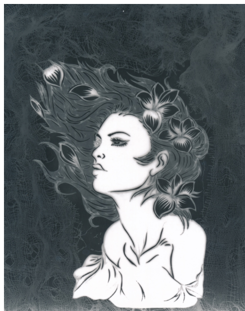
Gambar 1. Kembang Desa Kekinian 20 cm x 25cm, Media kertas ilford,2020

Kembang desa adalah salah satu ungkapan untuk wanita yang menjadi idola atau primadona di salah satu desa. Pencipta menggambaran bentuk wajah seorang wanita yang menonjolkan paras