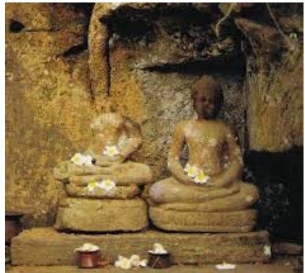
Gambar 3. Arca Dhyani Buddha di Pura Goa Gajah.

Pura ini terletak di Banjar Goa, Desa Bedulu juga menyimpan artefak dan bangunan Hindu maupun Buddha (gambar 3 dan 4). Artefak yang bercorak Hindu adalah arca Ganeśa, lingga, dan arca pancuran. Arca Ganeśa disimpan dalam sebuah ceruk di dalam gua. Arca ini digambarkan dalam sikap duduk di atas padma ganda. Kondisi arca tergolong masih baik. Arca digambarkan bertangan empat dengan atributnya adalah tangan kiri depan membawa mangkuk tengkorak, tangan kiri belakang membawa parasu , tangan kanan