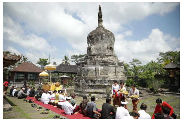
Gambar 1. Bangunan stupa Buddha di tengah-tengah bangunan suci pura.

Pura yang terletak di Banjar Basangambu ini terdapat beberapa artefak berupa arca Buddha dan fragmen tablet tanah liat. Yang menarik dari situs ini adalah adanya stupa Buddha di tengah-tengah bangunan suci pura (Gambar 1) (Astawa 2007, 6; Srijaya dan Wiguna 2018, 11). Tinggalan arkeologi di situs ini adalah sebuah bangunan stupa dan artefak berupa arca dan stupika tanah liat. Untuk memahami aspek ritual dari umat yang memanfaatkan stupa sebagai tempat ritual kiranya masih sulit untuk dijelaskan karena tidak adanya sumber-sumber tertulis yang dapat menjelaskan. Oleh karena itu, yang dapat dijelaskan dari temuan di situs ini mengenai keberadaan bangunan stupa di tengah tempat suci Hindu. Timbul pertanyaan, apakah bangunan stupa