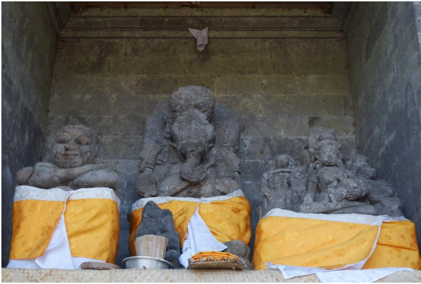
Gambar 6. Arca Hariti di Pura Goa Gajah.

Pura Goa Gajah berdasarkan sikap tangan ( mudrā ) terdiri atas Dhyani Buddha Amitabha dan Dhyani Buddha Amogasiidhi. Kedua arca Buddha ini ditempatkan dalam sebuah ceruk sebelah selatan gua. Dhyani Buddha Amitabha kondisinya masih bagus, terbuat dari batu andesit, digambarkan duduk dengan sikap padmasana , yaitu kaki kiri dan kanan ditekuk ke depan kaki kanan di atas kaki kiri dengan lapik berbentuk padmaganda . Rambut kriting menyerupai rumah siput di atasnya terdapat usnisha . Daun telinga panjang dan dibagian bawah terdapat lubang. Muka aus, hidung dan mulut aus, mata digambarkan setengah terpejam, dibagian tengah dahi terdapat urna . Kedua tangan diletakkan di depan perut tangan kiri berada di bawah tangan kanan dengan telapak tangan menghadap ke atas ( dhyana mudrā ). Dalam panteon Budhis, Dhyani Buddha ini sebagai penguasa arah barat. Kemudian Dhyani Buddha Amogasiidhi kondisinya sudah tidak utuh lagi dengan kepala sudah hilang. Terbuat dari batu andesit, sikap duduk padmasana di atas padmaganda . Pada bahu kiri terlihat jubah yang sangat tipis dan panjang sehingga menyentuh pergelangan kaki. Dari patahan tangan yang tersisa dapat diduga bahwa arca tersebut adalah Dhyani Buddha Amogasiidhi dengan sikap tangan abhaya mudrā dan menempati arah utara. Berdasarkan karakter yang diperlihatkan oleh kedua arca Dhyani Buddha yang memperlihatkan kesamaan