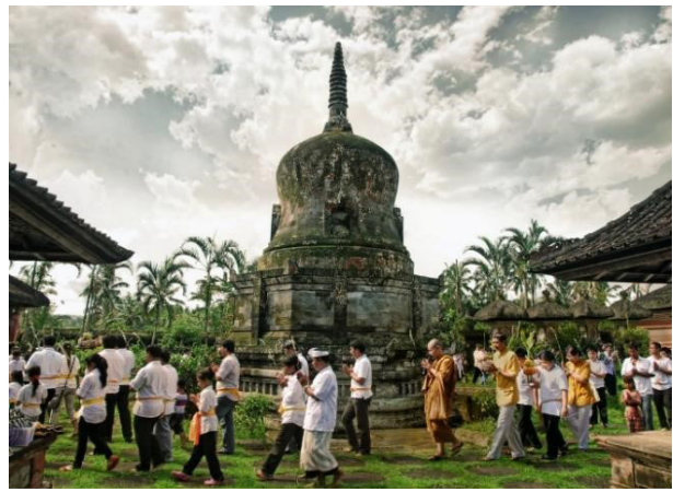
Gambar 2. Umat Buddha didampingi umat Hindu melakukan prosesi mengelilingi stupa.