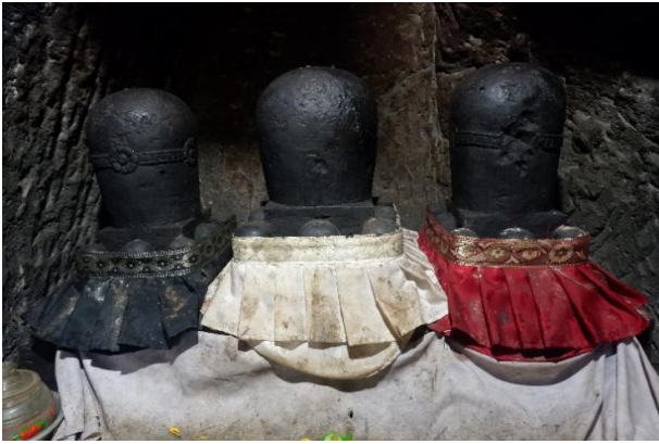
Gambar 4. Trilingga di Pura Goa Gajah.

depan membawa danta , dan tangan kanan belakang membawa akṣamāla . Sementara unsur-unsur badaniah seperti pakaian yang dikenakan memberikan kesan sebagai arca yang bergaya abad XIV (Wenten 1984, 84).