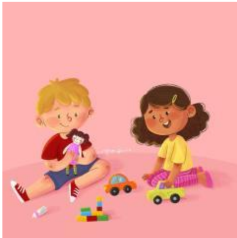
Gambar 1. Gaya Ilustrasi Kartun