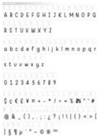
Gambar 2. Font Warung Kopi

Untuk tipografi, peneliti menggunakan jenis font sans-serif. Sans serif merupakan jenis huruf yang tidak memiliki sirip. Huruf sans serif memiliki sifat streamline, fungsional, dan kontemporer (Kusrianto, 2010:50). Font yang akan digunakan dalam perancangan buku cerita bergambar ini yaitu font Fredoka One untuk teks judul dan font Warung Kopi untuk body text.