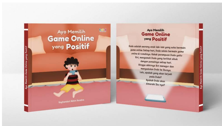
Gambar 6. Mock Up