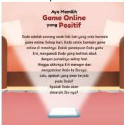
Gambar 9. Sampul Belakang

Sampul belakang dari buku cerita bergambar “Ayo Memilih Game Online yang Positif” memuat sinopsis cerita.