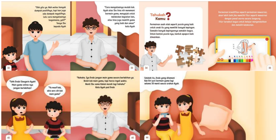
Gambar 8. Halaman Desain Isi