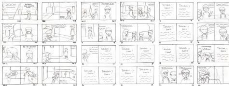
Gambar 5. Sketsa Tata Letak

persegi untuk tiap halamannya untuk memudahkan peneliti dalam proses pembuatan layout buku dan pewarnaan setiap halamannya. Menurut Maharsi (2016:81), layout ilustrasi buku anak seperti buku cerita bergambar memiliki pola yang bermacam-macam namun pada umumnya bentuk tata letaknya seragam. Halaman satu akan berkaitan dengan halaman selanjutnya, sehingga kedua halaman menjadi satu kesatuan yang saling berkaitan. Halaman yang berkaitan ini menjadikan ilustrasinya juga menjadi saling bersambungan. Dalam menentukan layout buku cerita bergambar, peneliti menggunakan sistem grid untuk menentukan tata letak tulisan dan ilustrasi. Sistem grid berperan untuk membantu desainer untuk menjaga keteraturan desain. Sistem grid dapat menciptakan keharmonisan visual. Sistem grid memberikan fasilitas untuk berkreaitivitas dengan menyediakan kerangka bekerja (Anggraini & Nathalia, 2014:78).