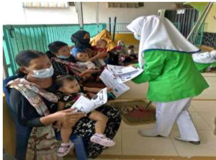
Gambar 1. Kegiatan edukasi

edukasi kontrasepsi Pengetahuan wanita usia subur tentang Kontrasepsi meningkat mencapai (87%).