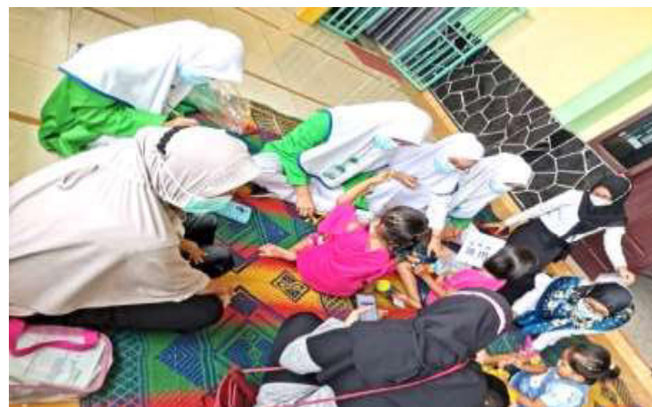
Gambar 2. Kegiatan edukasi