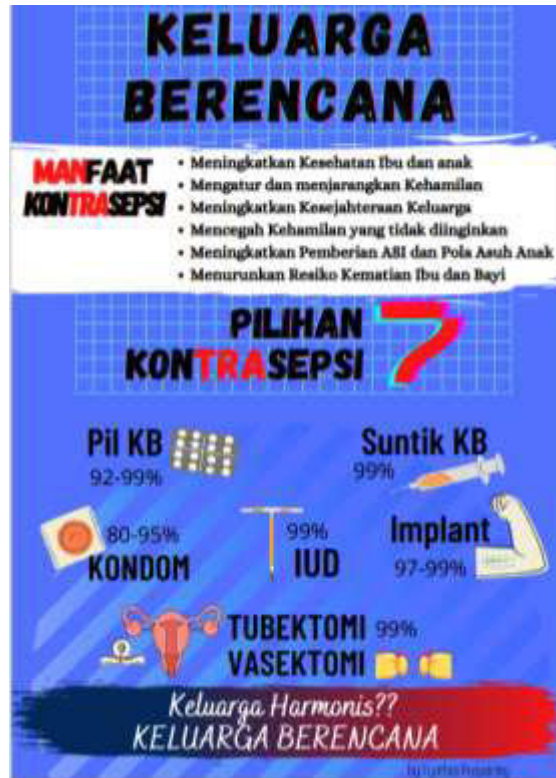
Gambar 3. Poster Kontrasepsi

Edukasi tahap ke dua dilakukan menggunakan media poster. Menurut SR et al., 2014 dalam Aktifah, N dkk 2022 Edukasi dengan metode ceramah terbukti dapat meningkatkan pengetahuan akan tetapi kondisi saat pengetahuan akan melibatkan tahapan kegiatan yang membutuhkan imajinasi agar lebih memahami ketrampilan maka penggunaan metode ceramah kurang maksimal. Pendidikan Kesehatan akan lebih baik menggunakan metode ceramah disertai dengan media pembelajaran lain yang menarik sehingga tidak membosankan. Dalam hal ini maka menggunakan poster yang berwarna dan bergambar menarik dapat meningkatkan ketertarikan untuk lebih memahami isi pesan yang disampaikan termasuk pengetahuan mengenai kontrasepsi.