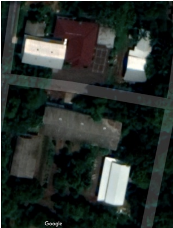
Gambar 3-1: Denah Lokasi Gedung Radiografi

olah raga bulu tangkis tampak berada di depan gedung