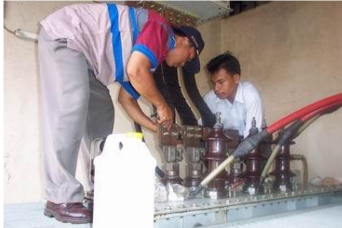
Gambar 5. Pemasangan kabel setelah dilakukan pengukuran [3]

Gambar 5 di bawah adalah kegiatan pemasangan kembali kabel-kabel trafo setelah dilakukan pengukuran dan pembersihan pada baut-baut terminal kabel.