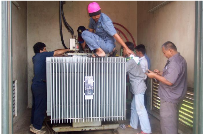
Gambar 2. Pelepasan Kabel Trafo BHT03 [3]

Pada Gambar 2 di atas dilakukan pekerjaan pelepasan kabel-kabel trafo, selanjutnya dilakukan pengukuran kabel antara phasa dengan phasa, phasa dengan ground sebelum dilakukan proses purifikasi.