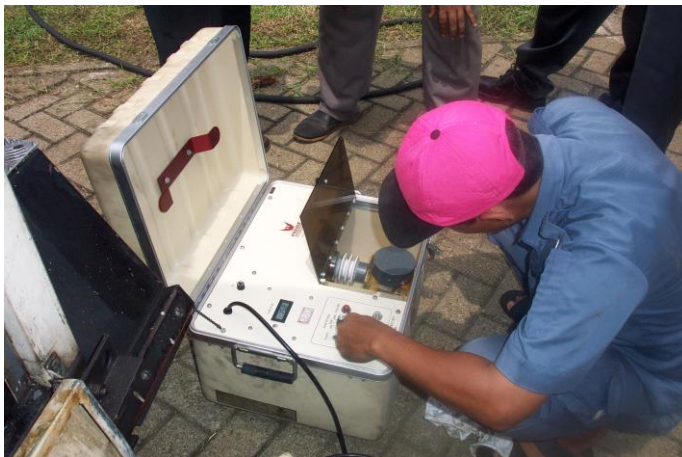
Gambar 3. Pengujian sampel minyak menggunakan Breakdown Voltage [3]

Alat yang digunakan untuk mengetahui tingkat viskositas minyak yaitu Viscosity Meter , sedangkan alat yang digunakan mengukur tegangan tembus minyak trafo yaitu Breakdown Voltage .